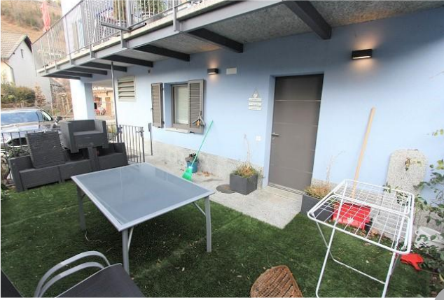
Eingang, Wohn-/Esszimmer mit Küche ● entrata, soggiorno/pranzo e cucina