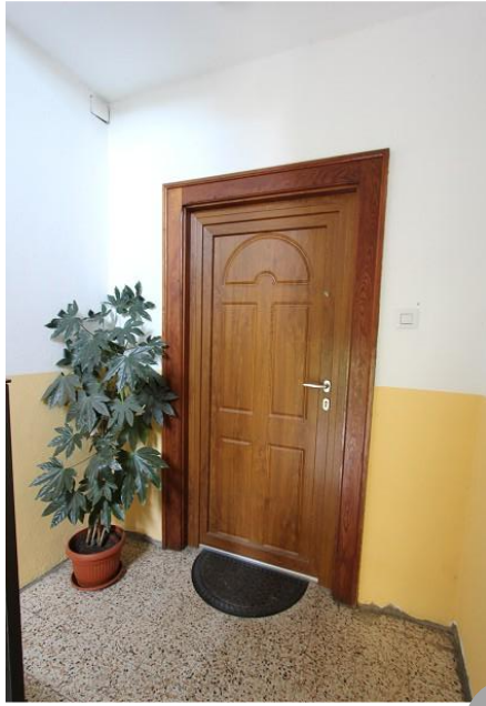
Eingang, Küche, Ess-/Wohnzimmer ● entrata, cucina, soggiorno/pranzo