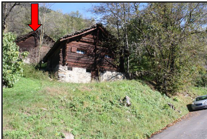
Vista da sotto verso rustico / Blick von unten auf Rustico