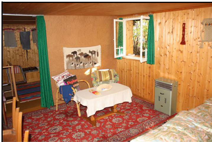
Camera / Schlafzimmer