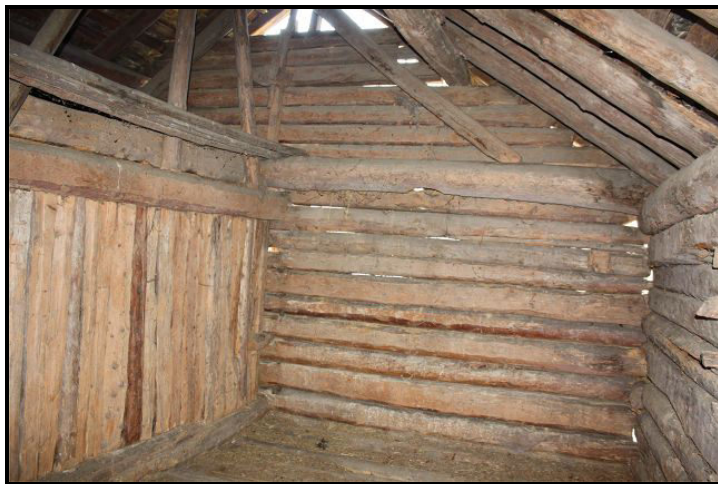
Parte sopra / Dachgeschoss