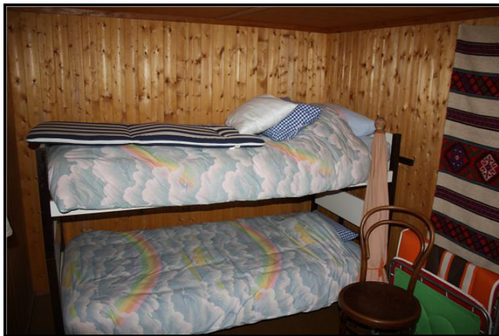
Piccola stanza / kleines Zimmer