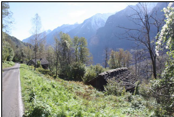
Vista verso sud / Südblick