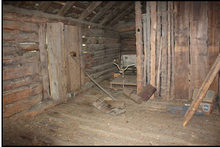
Parte sopra / Dachgeschoss