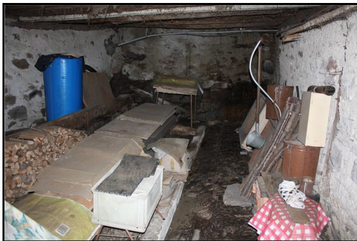
Locale PT / Raum im Erdgeschoss