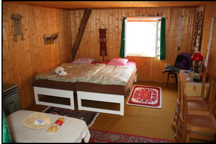
Camera / Schlafzimmer