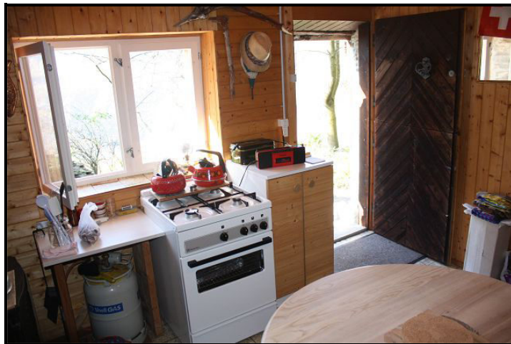
Cucina / Kochbereich