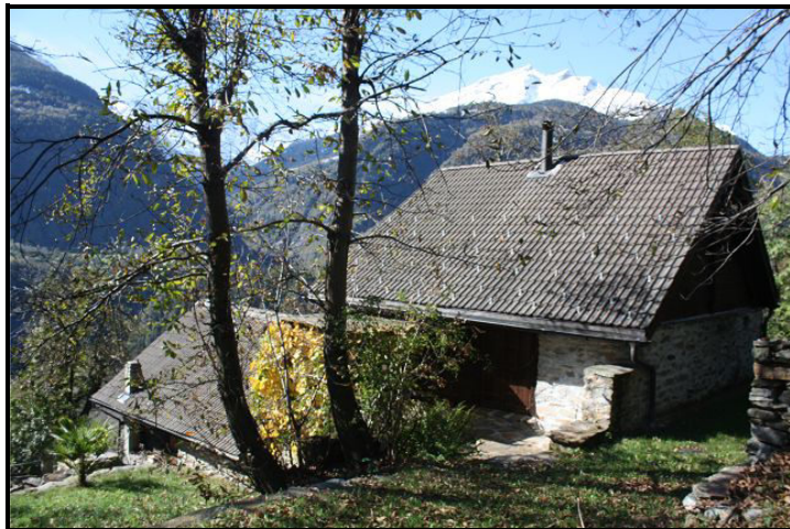
Vista verso ovest / Westblick