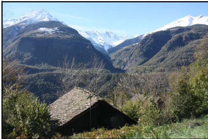
Vista da sopra / Blick von oben