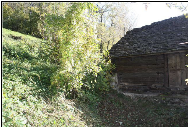
Cortile nord / Nordsitzplatz