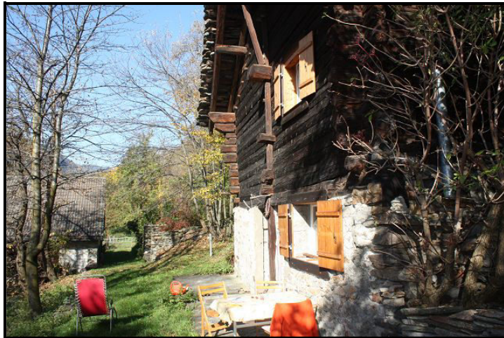
Cortile / Sitzplatz