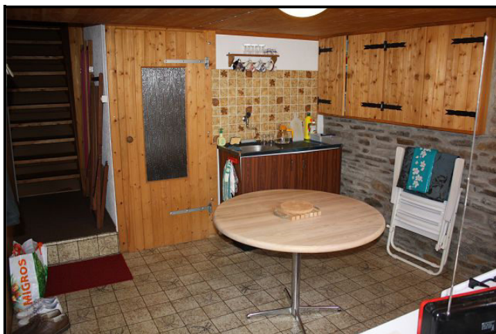
Soggiorno / pranzo / cucina / Wohn-/Essbereich mit Küche