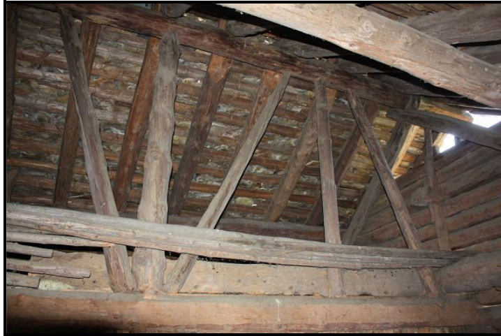
Solaio / ungebauter Dachraum