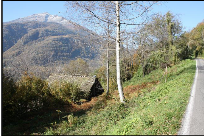
Accesso sopra / Zufahrt von oben