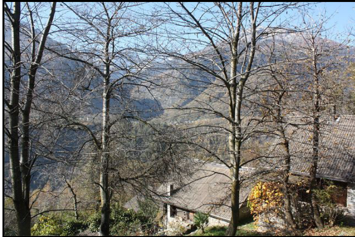
Vista verso sud-ovest / Südwestblick