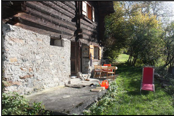
Cortile / Sitzplatz