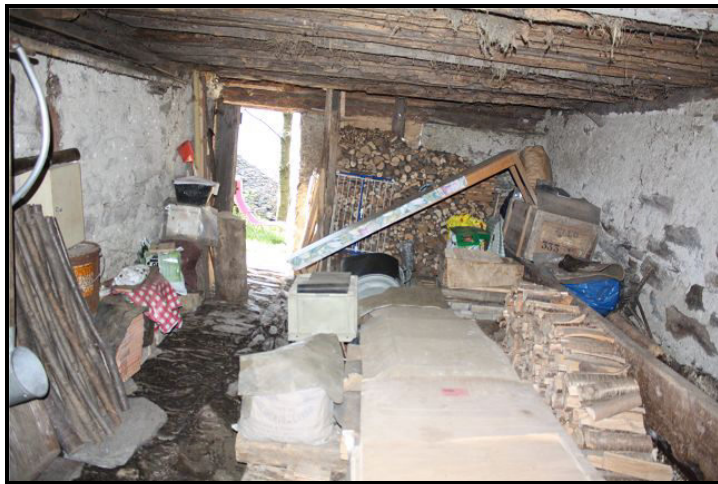
Locale PT / Erdgeschoss