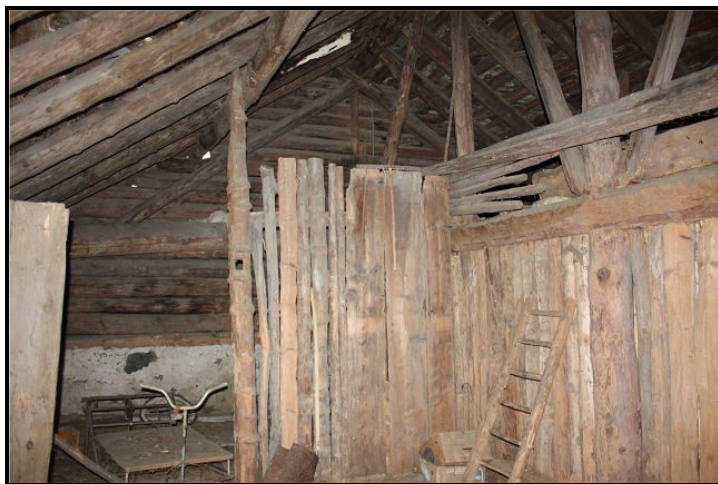
Parte sopra / Dachgeschoss