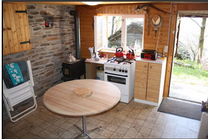
Soggiorno / pranzo / cucina / Wohn-/Essraum mit Küche