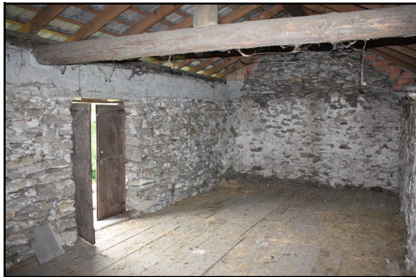
Sotto tetto / Dachgeschoss