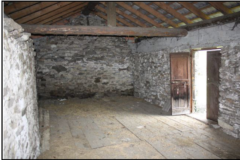
Sotto tetto / Dachgeschoss