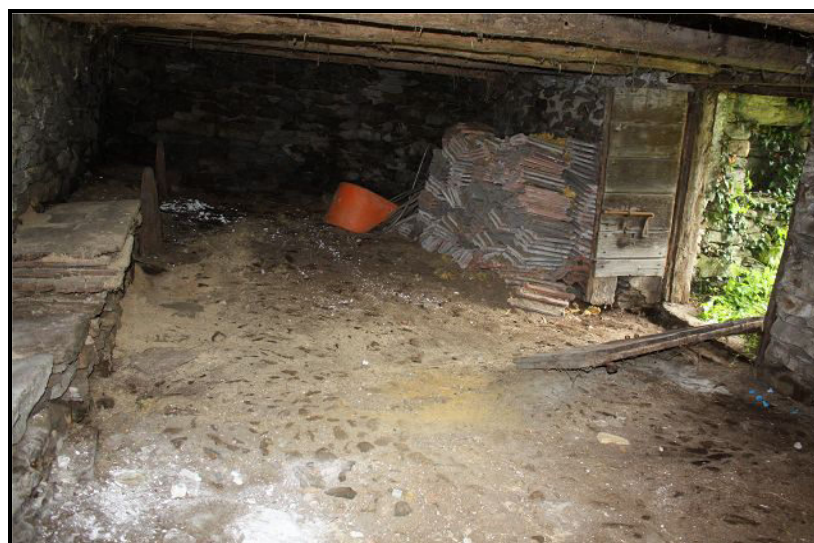
Piano terra / Erdgeschoss