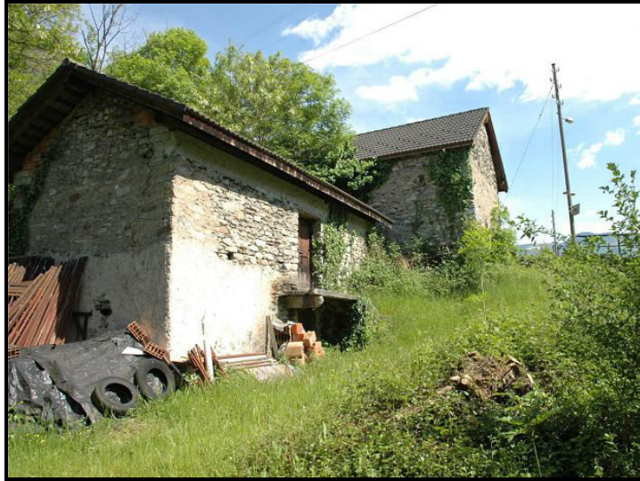
Due rustici / zwei Rustici