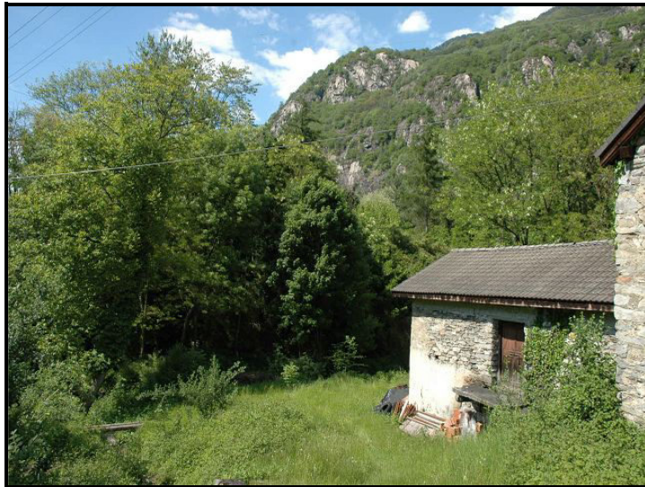
Vista verso nord / Nordblick