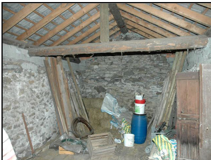
Sotto tetto / Dachgeschoss