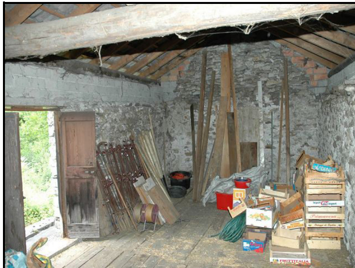
Sotto tetto / Dachgeschoss