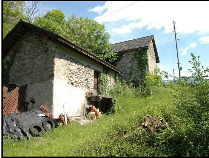
Due rustici / zwei Rustici