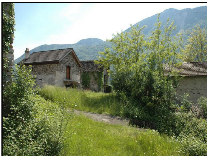
Prato e vista sud / Wiese und Südblick