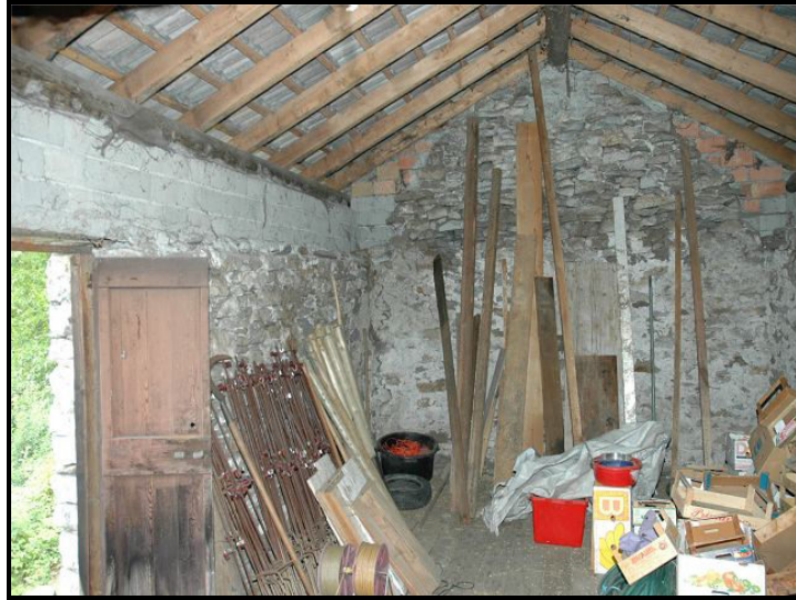
Sotto tetto / Dachgeschoss