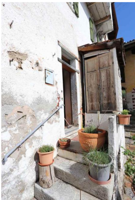
Eingang, Wohn-/Essberich, Küche ● entrata, cucina, pranzo/soggiorno