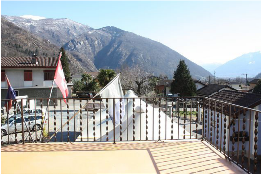
Ausblick Terrasse und Estrich ..... vista e spazio mansardato