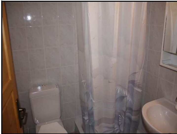
Doccia / Dusche