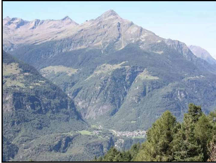
Vista ovest / Westblick