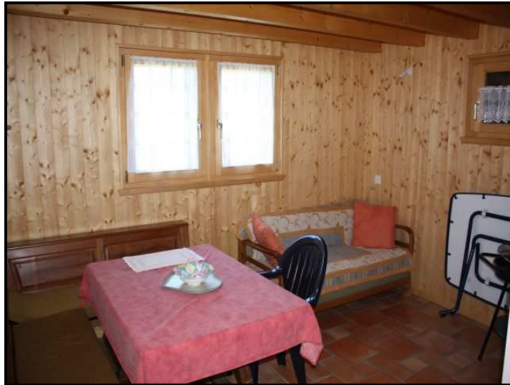
Soggiorno / pranzo / Wohn-/Essbereich