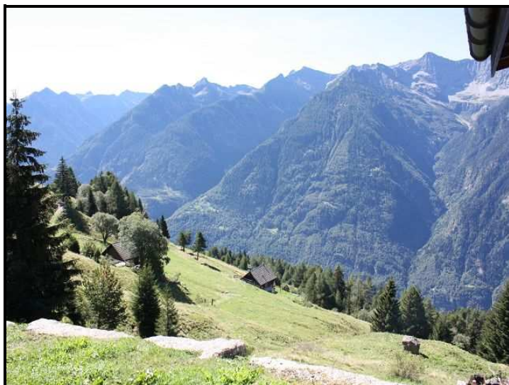
Vista sud/ Südblick