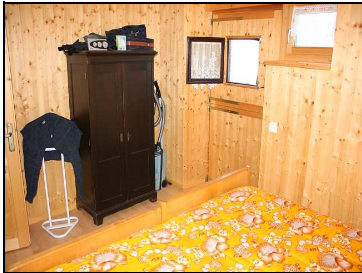
Camera / Zimmer