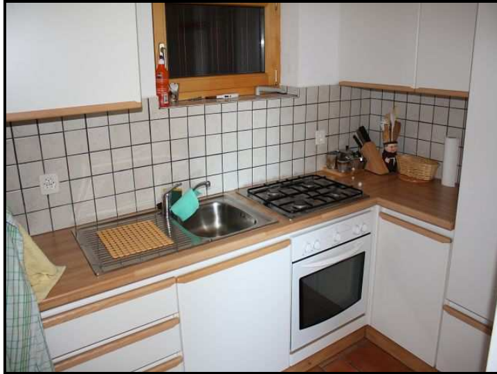
Cucina / Küche