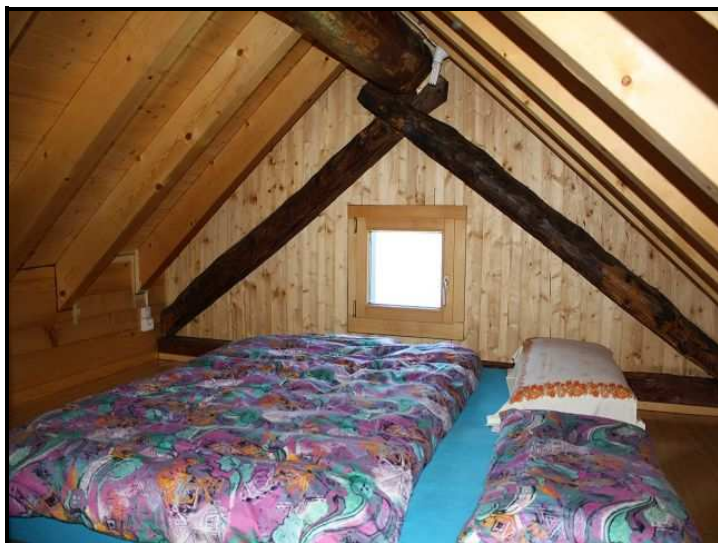
Mansarda / Mansarde