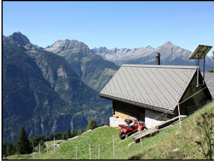
Rustico da sopra / Blick auf Rustico