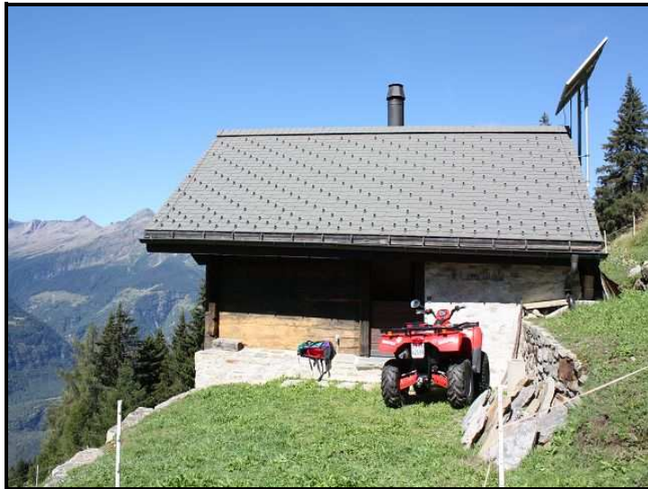
Cortile / Sitzplatz