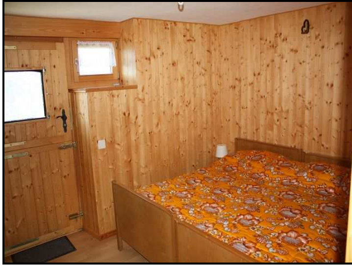
Camera / Zimmer