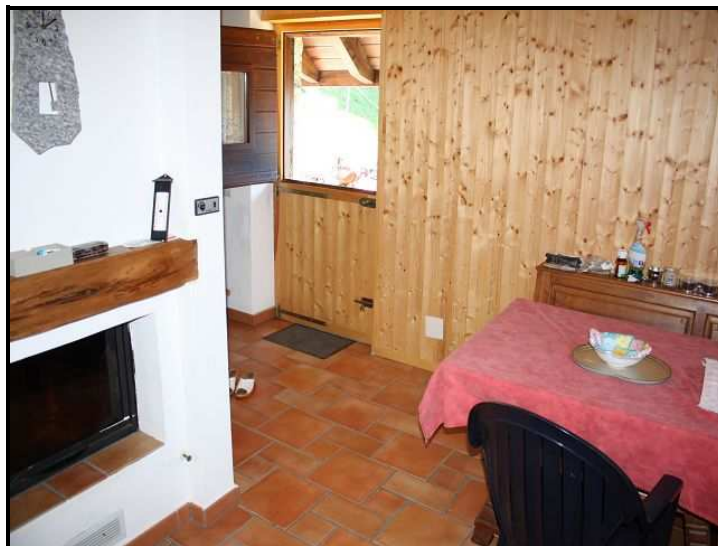
Pranzo con camino / Essbereich mit Kamin