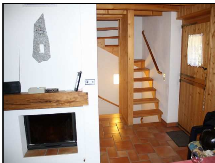
Camino e scala / Kamin mit Treppe