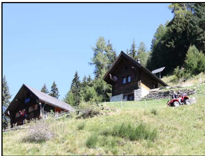
Vista da sotto / Blick von unten