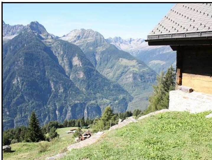
Vista nord-ovest / Blick nach Nordwesten