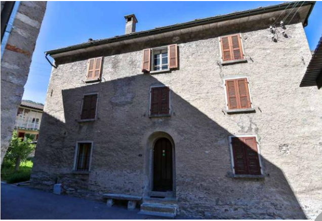
Eingang, Küche und Dusche/WC ● entrata, cucina e doccia/WC