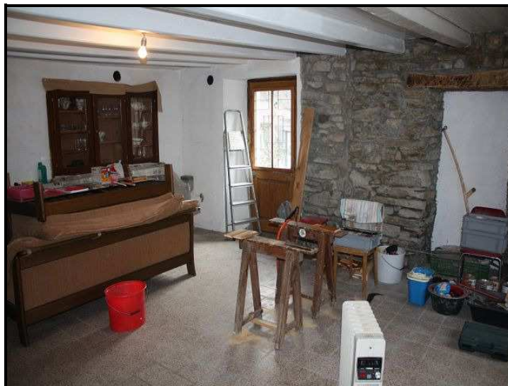
Soggiorno PT / Wohnraum im Erdgeschoss