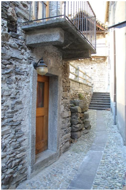
Eingang, Zimmer und Küche im OG ● entrata, camera e cucina nel 1° piano