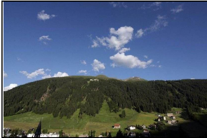
Blick auf Jakobshorn