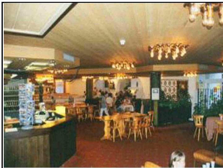
Reception / Sala