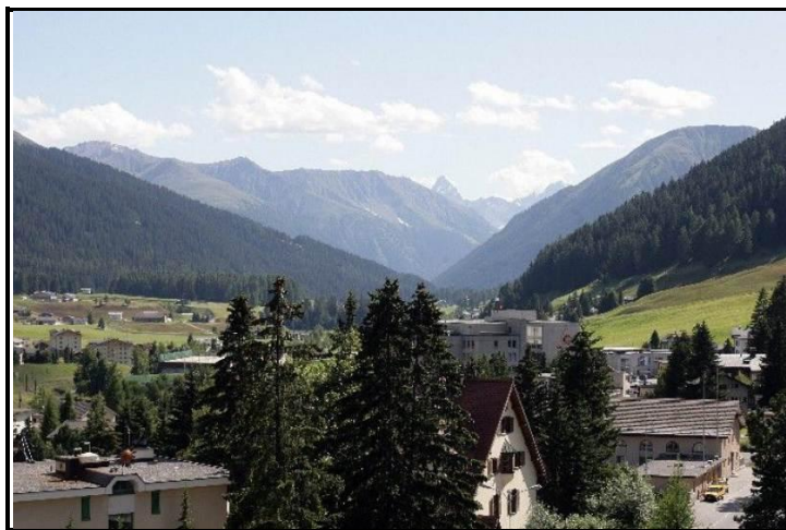
Blick nach Westen / Vista verso ovest