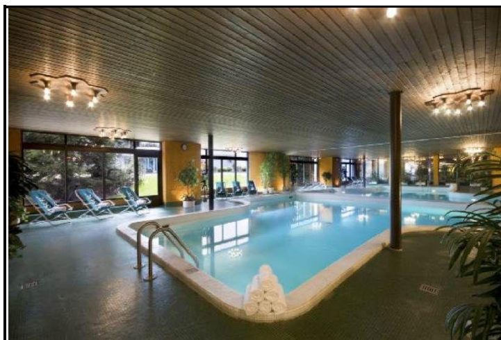
Schwimmbad / piscina