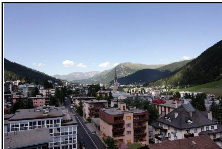
Blick nach Osten / Vista verso est