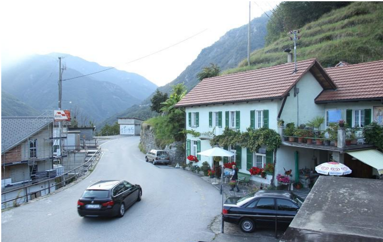
Aussicht ..... bella vista