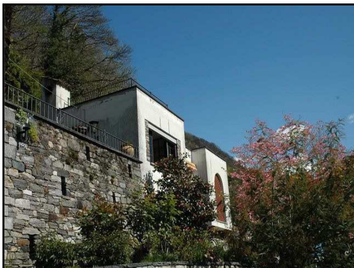
Vista sulla villetta / Blick auf die Villetta