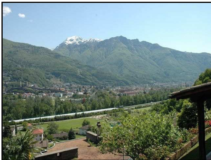
Vista sul Monte Tamaro / Blick auf Monte Tamaro