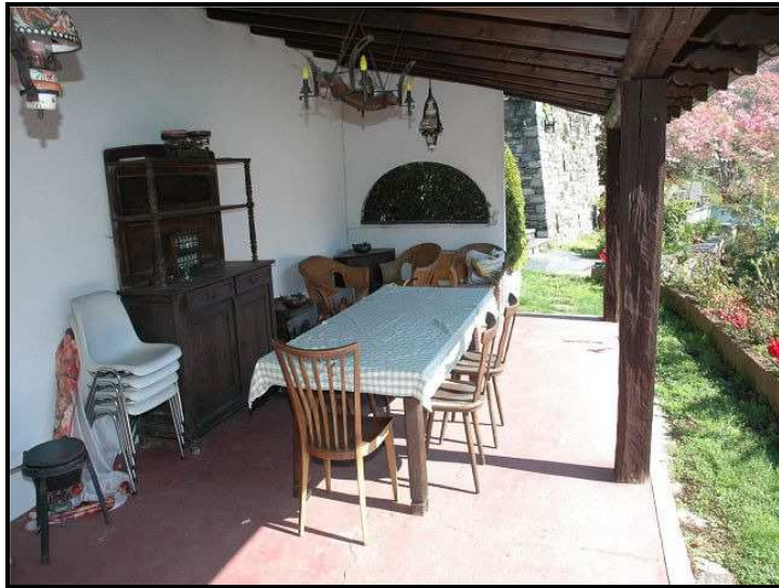
Portico con camino / Portico mit Kamin