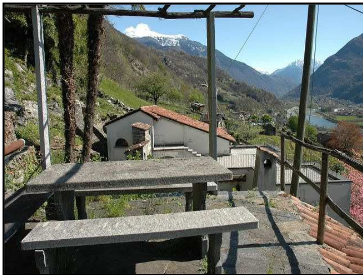
Vista verso est / Ostblick