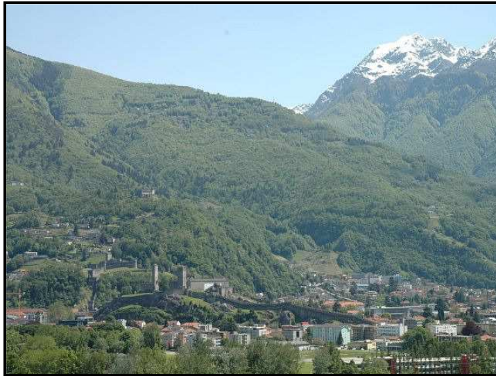
Vista verso Bellinzona e castelli / Blick nach Bellinzona und auf Schlösser