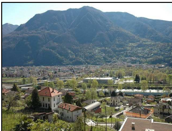
Vista verso nord-est / Blick nach Nord-Osten