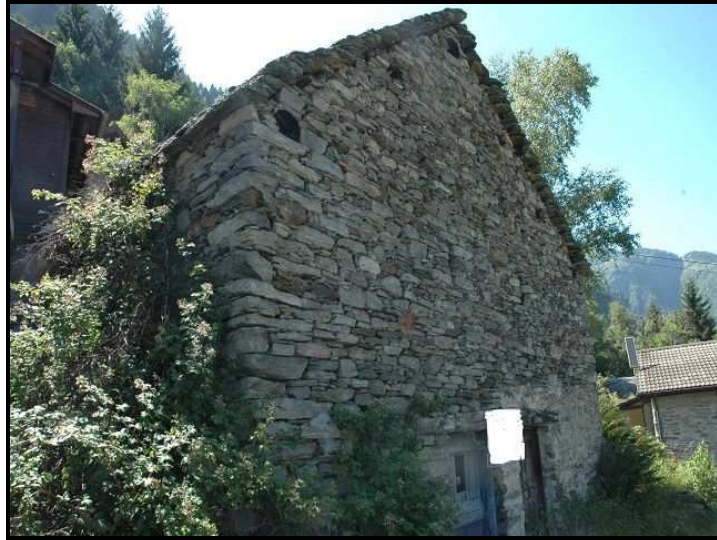
Facciata con l'entrata sotto / Fassade mit Eingang unten