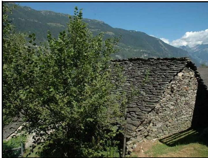
Facciata ovest / Westfassade