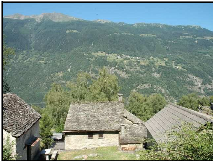
Vista verso est / Ostblick