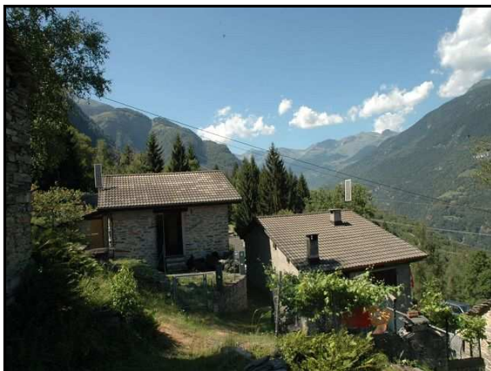
Vista verso nord / Nordblick