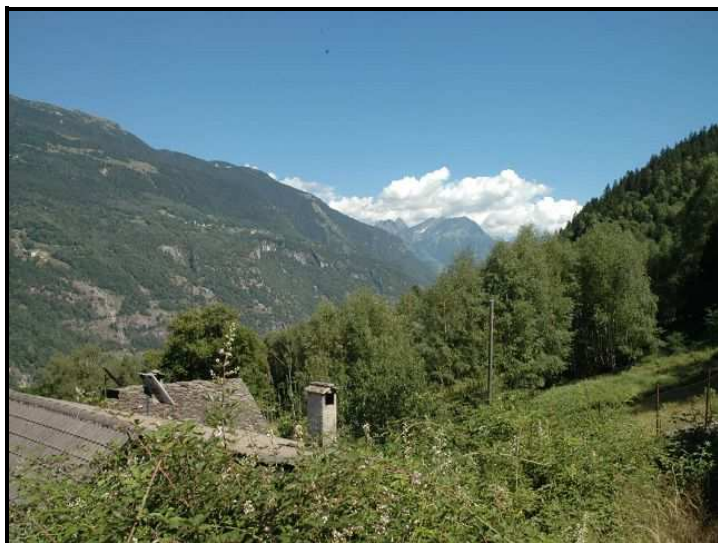
Posto del giardino e vista sud-est / Sitzplatz mit Südostblick