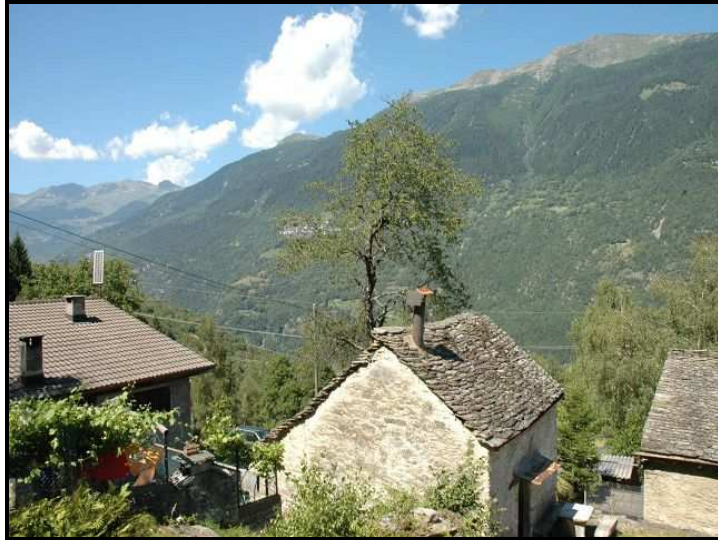
Vista verso nord-est / Blick nach Nordosten