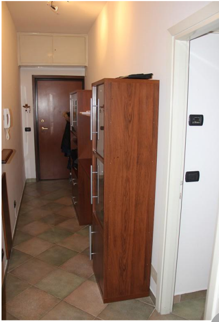
Eingang, Bad und Küche mit Wohnraum ● entrata, bagno, cucina e soggiorno