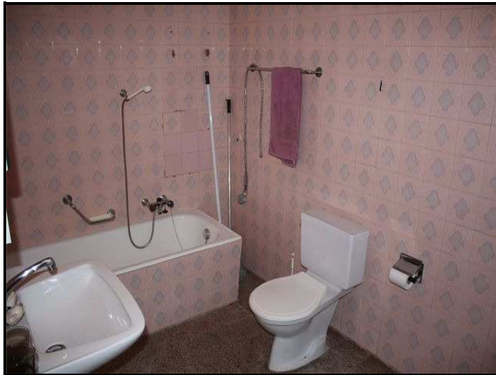
Bagno/WC / Bad/WC