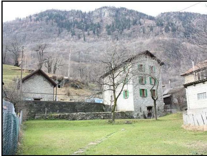
Giardino con casa / Garten mit Haus