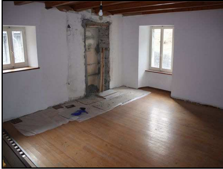
Soggiorno nel primo piano / Wohnraum im 1. OG