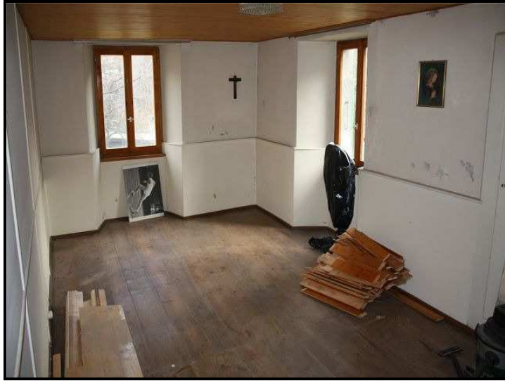
Camera / Zimmer