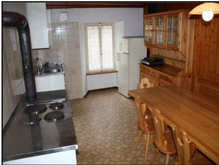
Cucina nel primo piano / Wohnküche im 1. OG