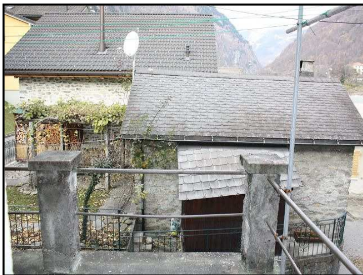
Terrazza / Terrasse