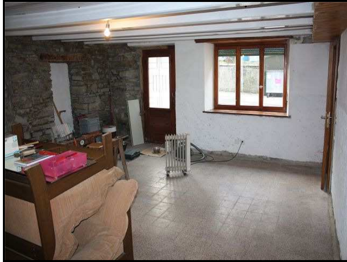
Soggiorno PT / Wohnraum im Erdgeschoss