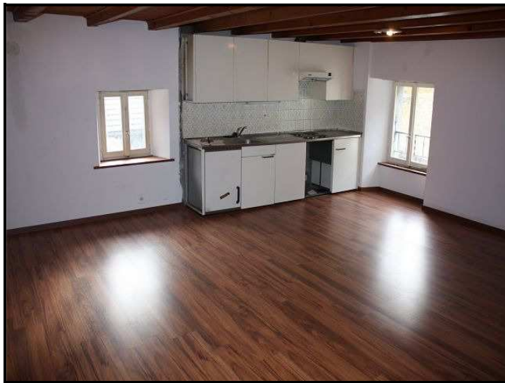
Appartamento sotto tetto / Dachwohnung