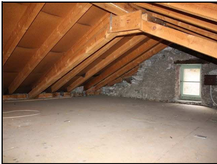
Solaio / Estrich