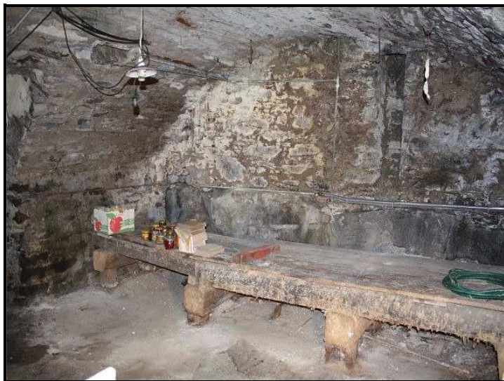
Cantina / Keller