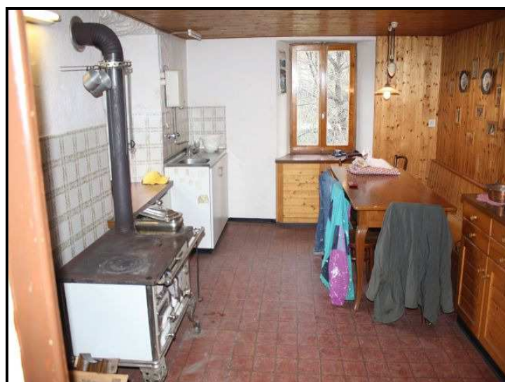
Cucina nel PT / Wohnküche im Erdgeschoss