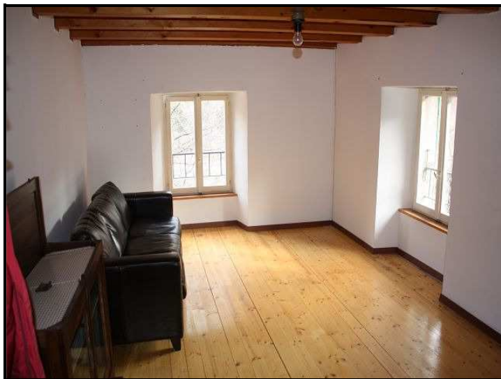
Camera sotto tetto / Zimmer im Dachgeschoss