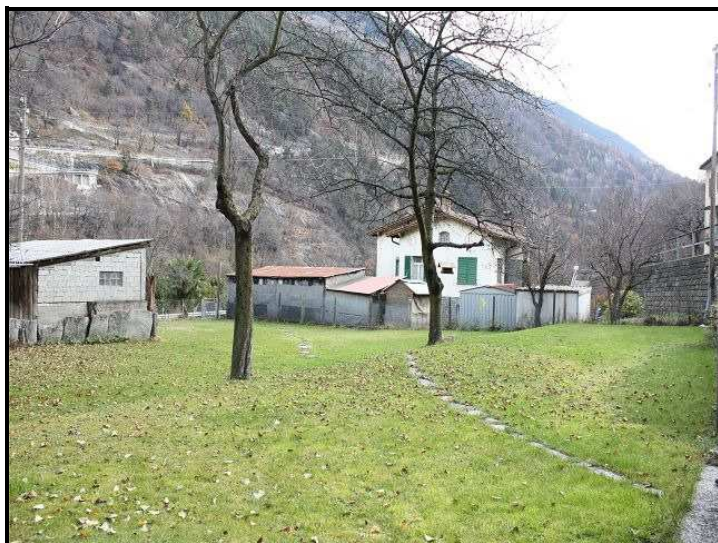
Giardino con vista sud-est / Garten mit Südostblick