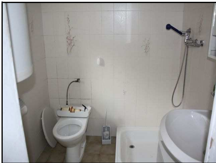
Doccia/WC nel primo piano / Dusche/WC im 1. OG