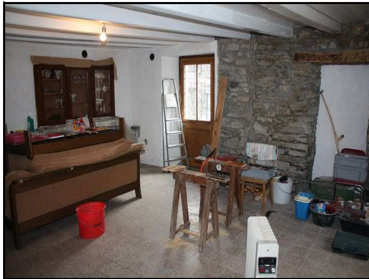
Soggiorno PT / Wohnraum im Erdgeschoss