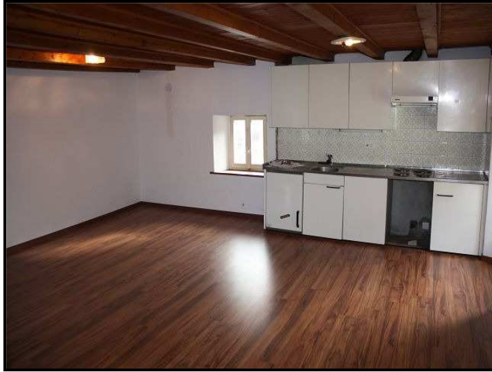
Appartamento sotto tetto / Dachwohnung