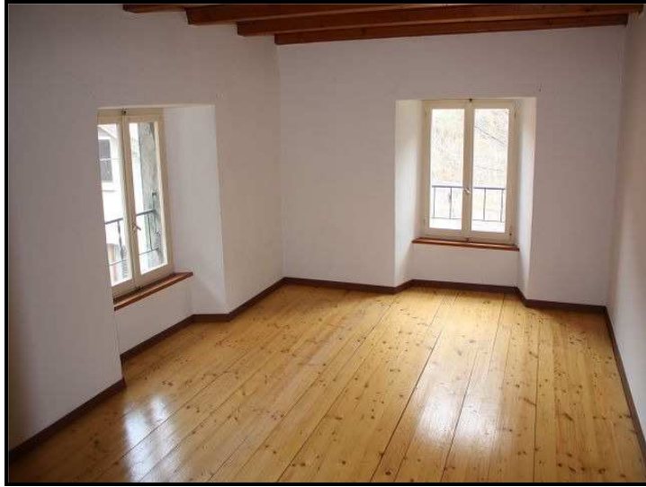
Camera sotto tetto / Zimmer im Dachgeschoss