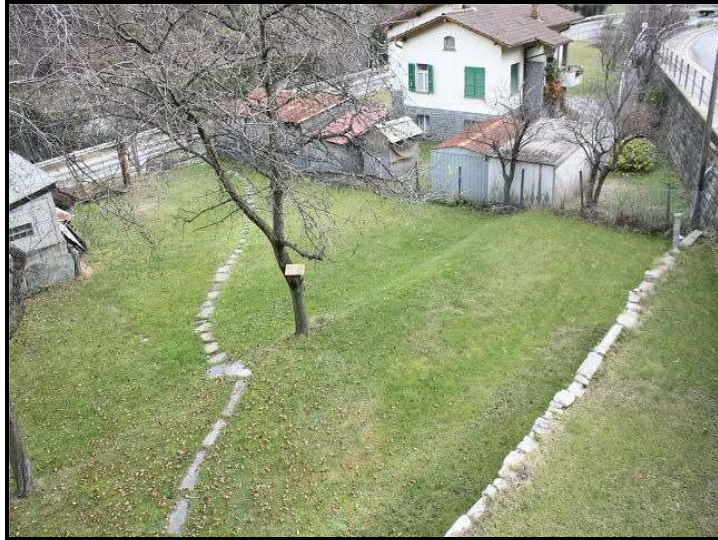
Giardino / Garten