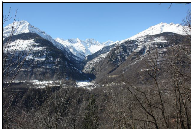
Vista verso Chironico / Blick nach Chironico