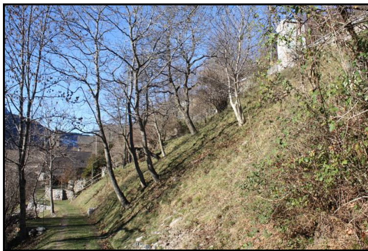
Terreno / Grundstück