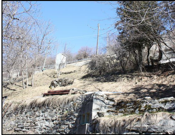
Terreni / Baulandgrundstücke