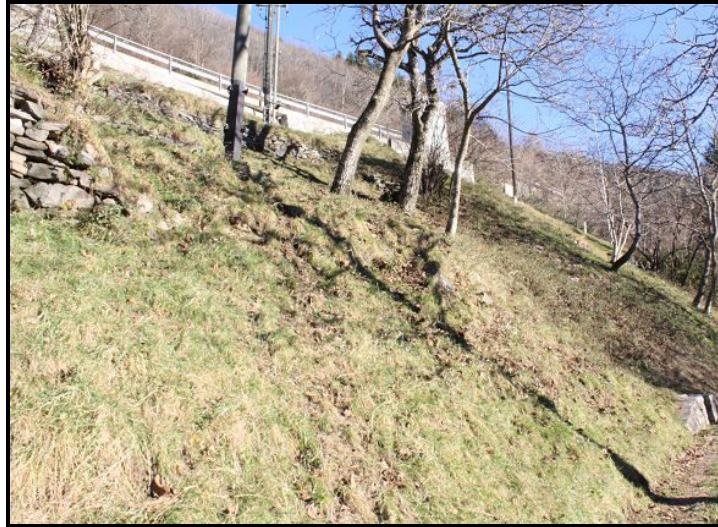
Accesso / Zufahrt