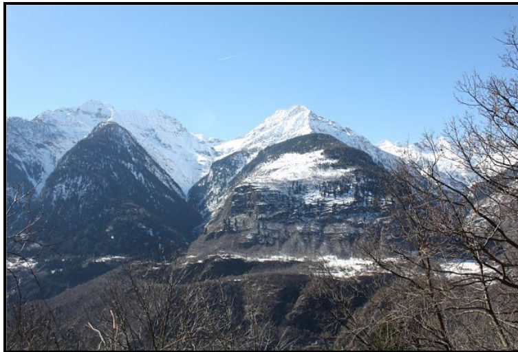
Vista / Ausblick