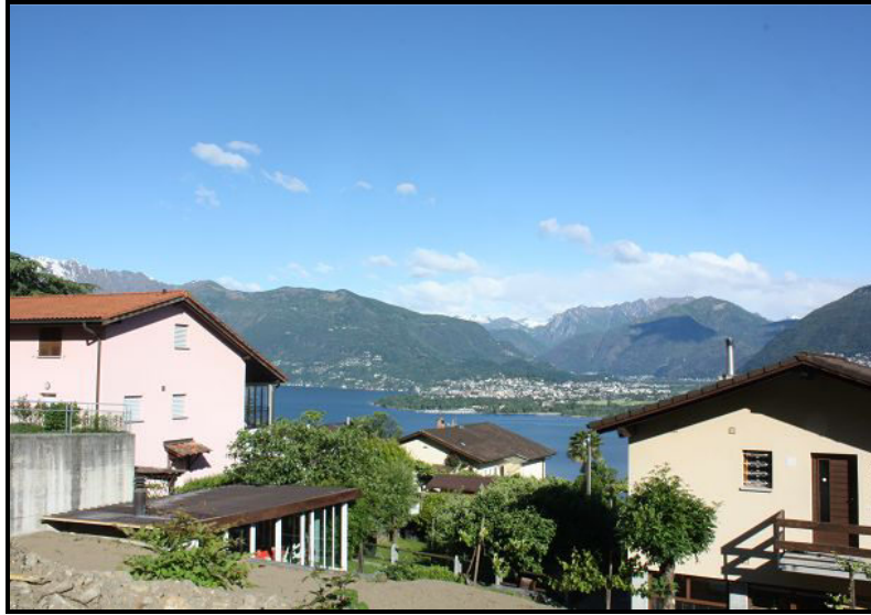
Vista verso Ascona / Blick nach Ascona