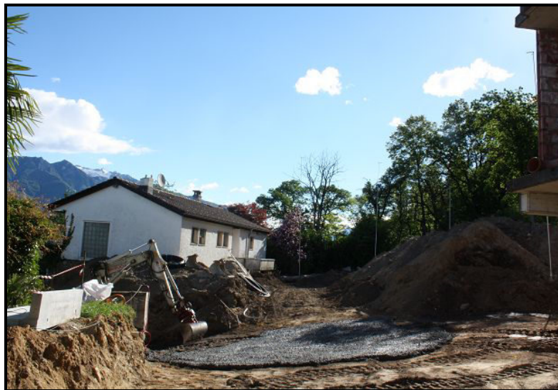
Accesso / Zufahrt