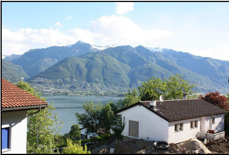
Vista verso Locarno / Blick nach Locarno