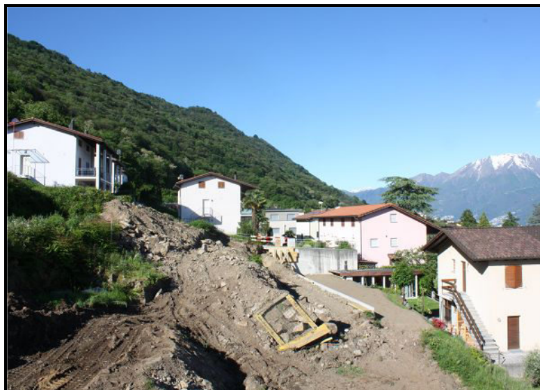
Vista sud-ovest / Südwestblick