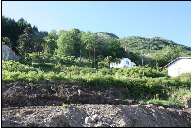
Vista sud-est / Südostblick