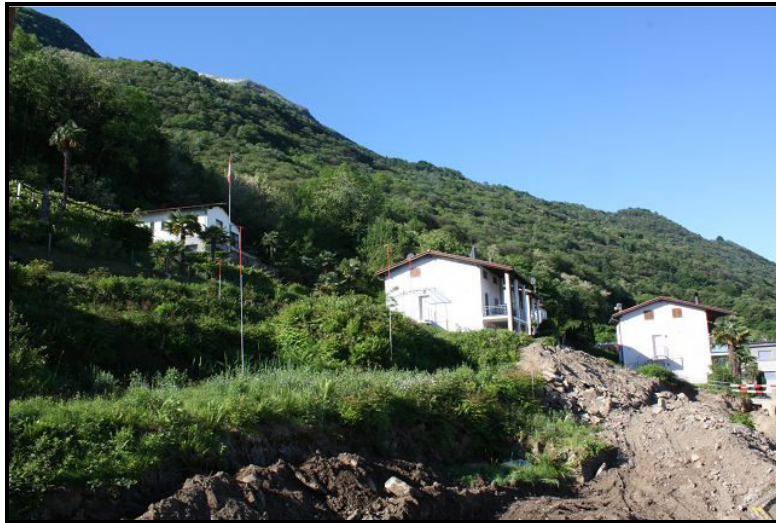
Vista sud / Südblick