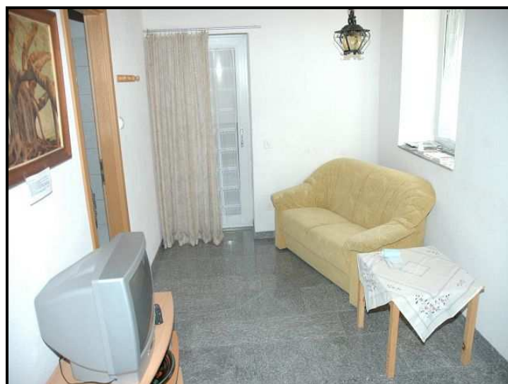
Soggiorno / Wohnbereich