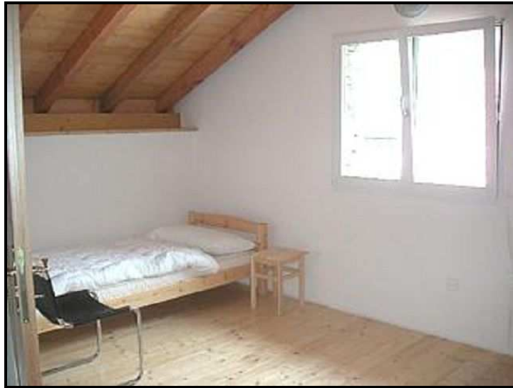
Camera sotto tetto / Dachzimmer