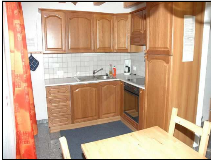
Cucina / Küche