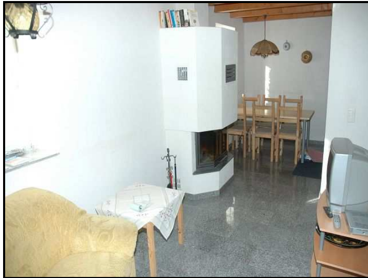
Soggiorno / Pranzo / Wohn-/Essraum