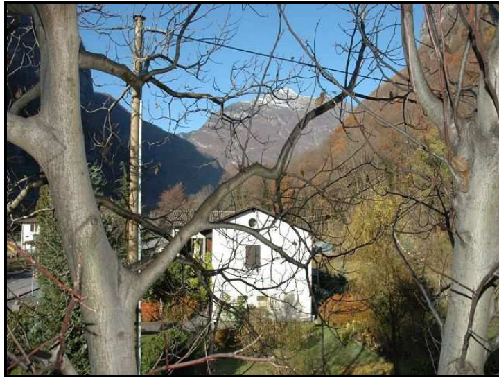
Vista verso nord / Blick nach Norden