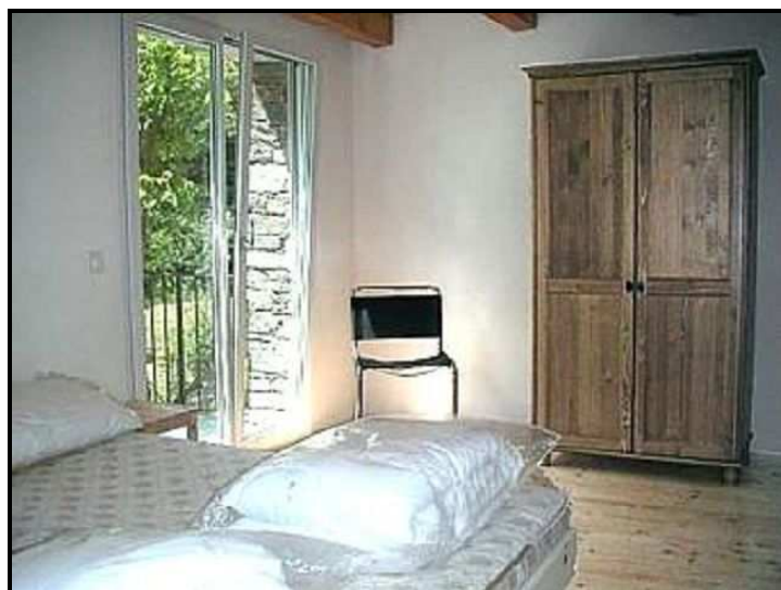
Camera con balcone / Zimmer mit Balkon