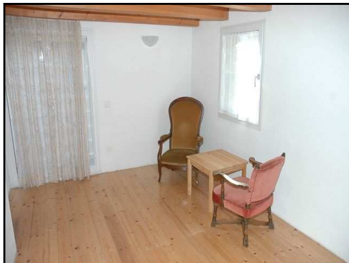
Soggiorno primo piano / Wohnbereich im 1. OG