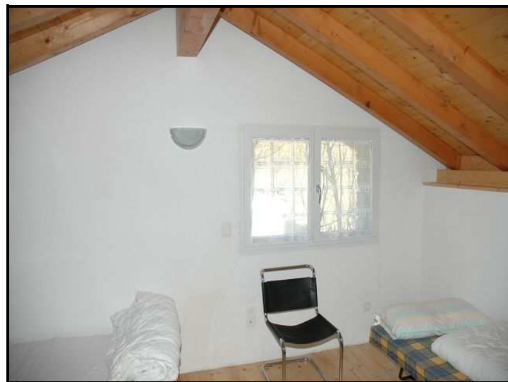
Camera sotto tetto / Dachzimmer