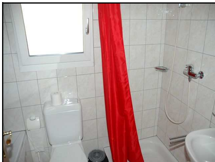
Bagno/doccia/WC / Bad/Dusche/WC