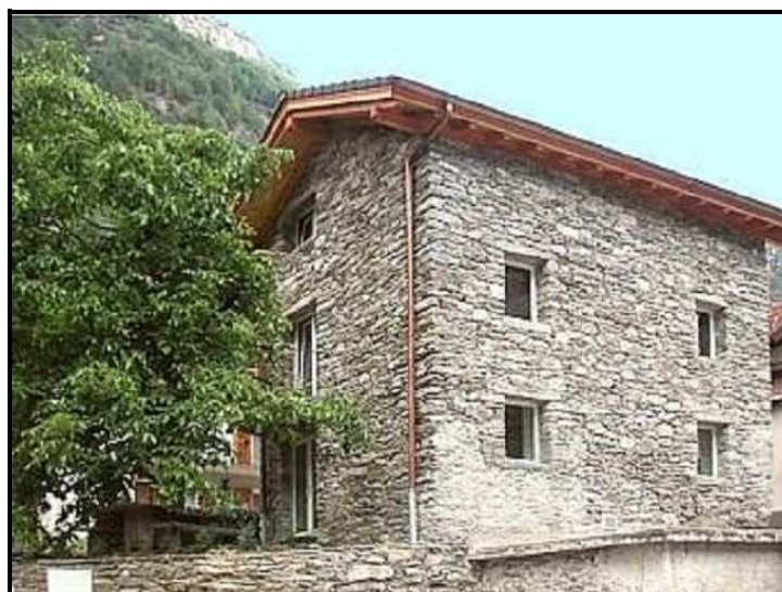
Rustico con pergola / Rustico mit Pergola