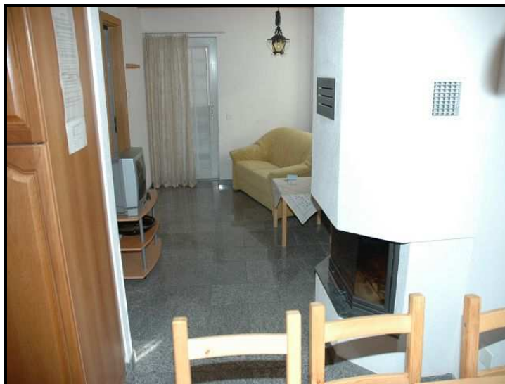
Soggiorno con camino / Wohnbereich mit Kamin