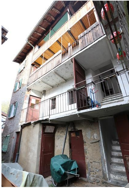
Eingangsbereich, 1.OG mit Wohnraum ● zona entrata, 1° piano: soggiorno