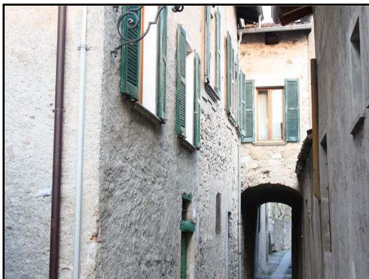
Vista verso casa / Blick zum Haus