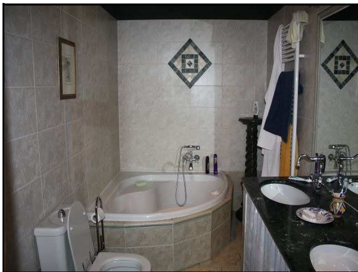
Bagno / Bad