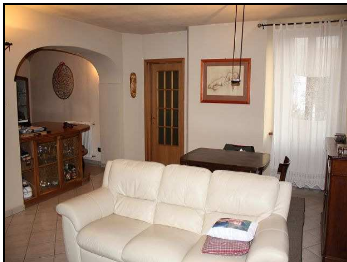
Soggiorno / Wohnzimmer