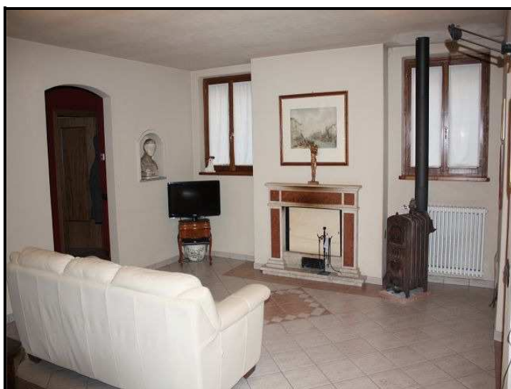
Soggiorno / Wohnzimmer