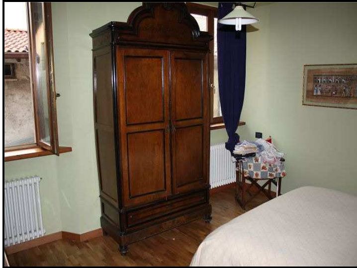
Camera / Zimmer