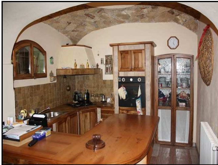
Cucina / Küche