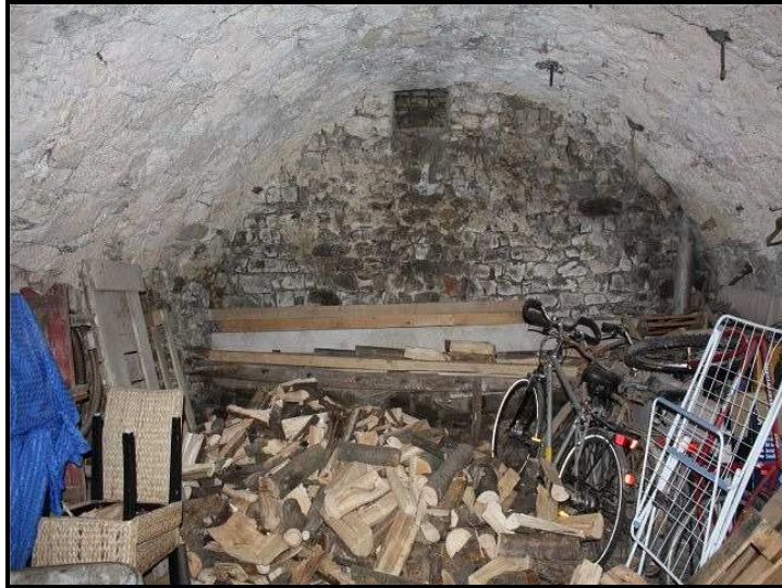
Cantina / Keller