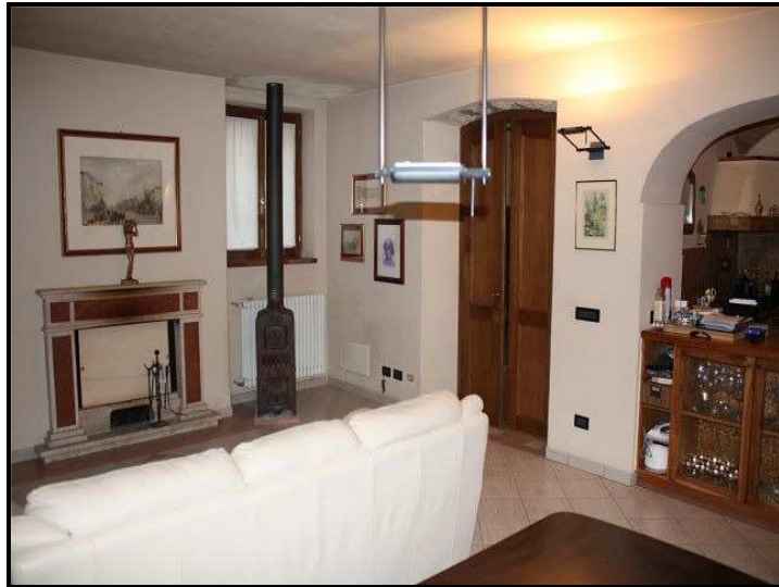
Soggiorno / Wohnzimmer