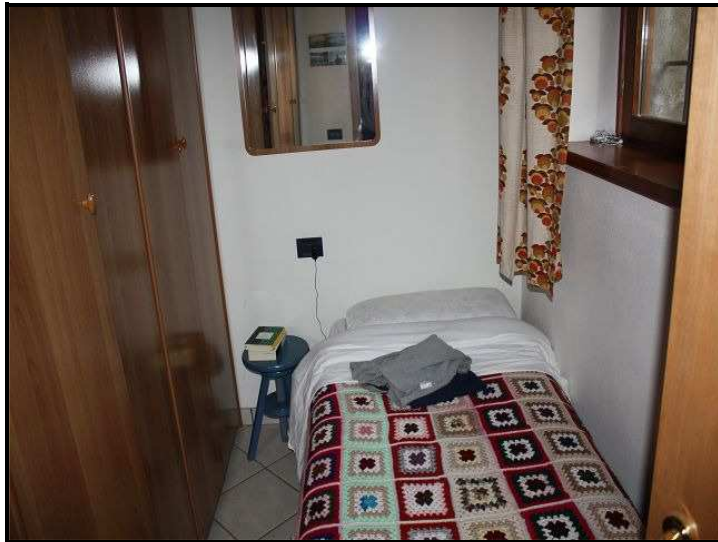
Camera / Zimmer