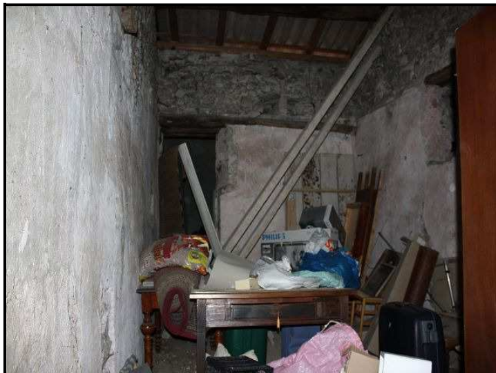
Sotto tetto / Dachraum