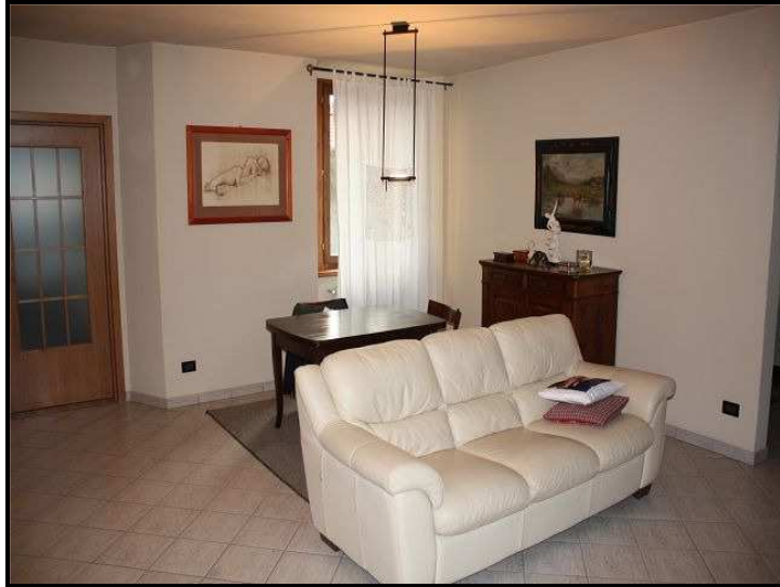
Soggiorno / Wohnraum