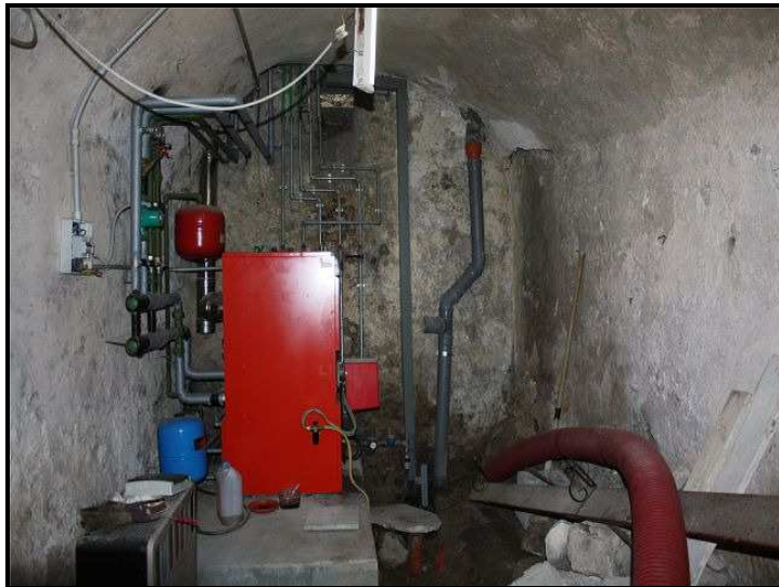
Riscaldamento / Heizung