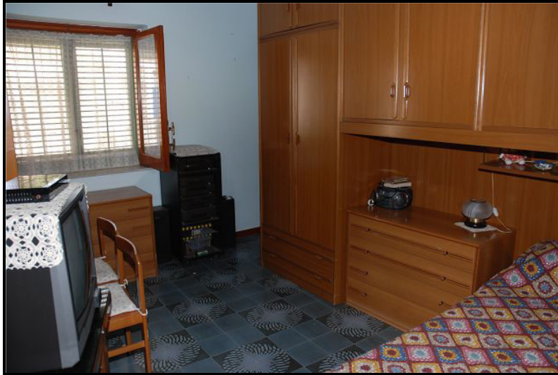
Camera / Zimmer