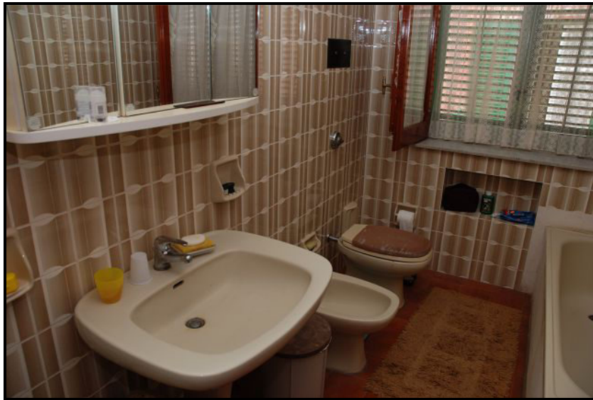
Bagno / Bad