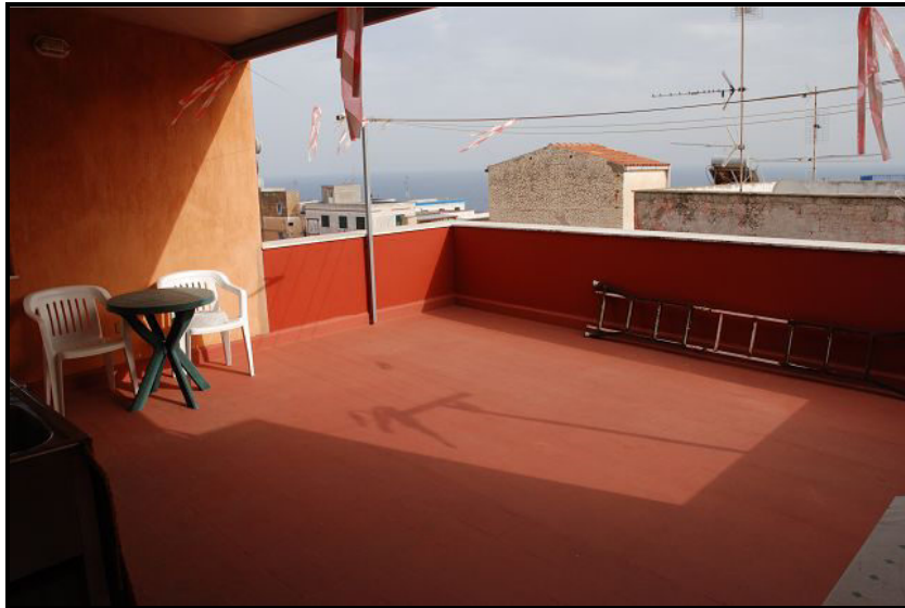
Terrazza con vista mare / Blick auf Meer