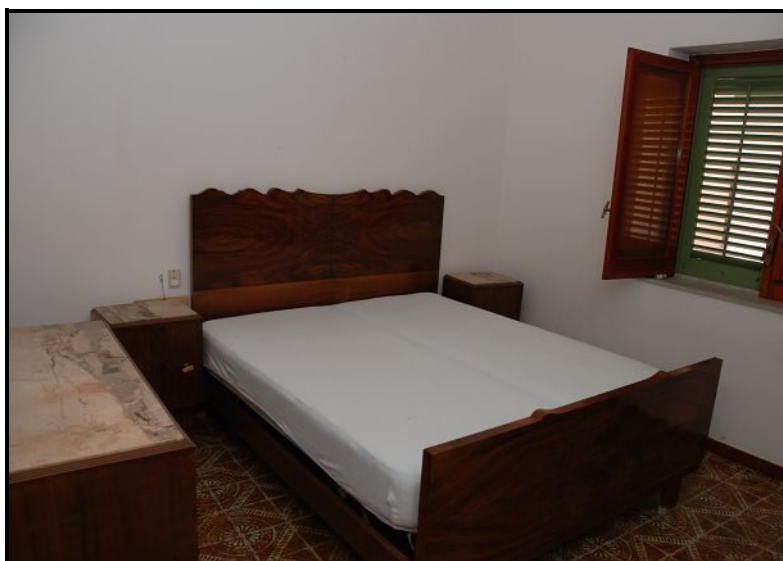
Camera / Zimmer