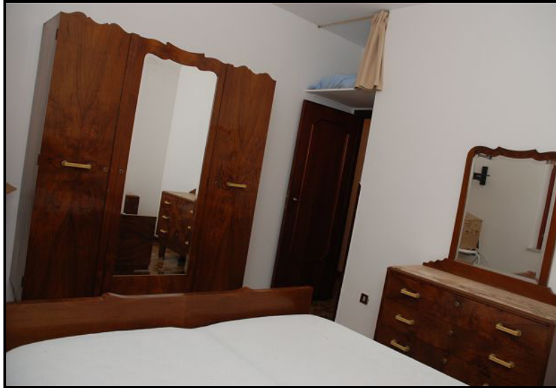
Camera / Zimmer