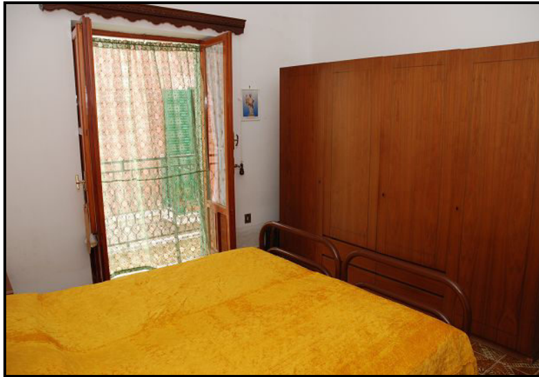
Camera / Zimmer