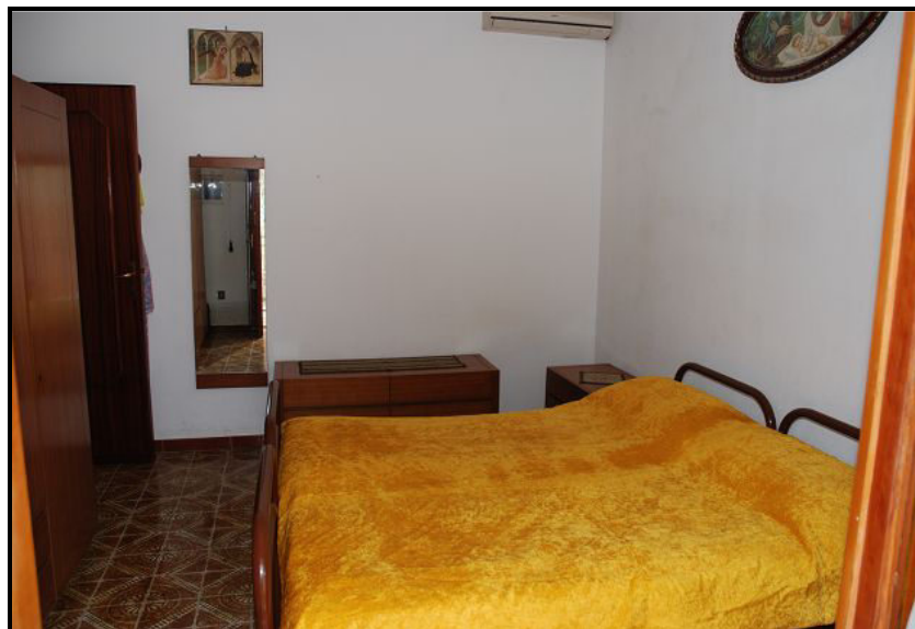
Camera / Zimmer