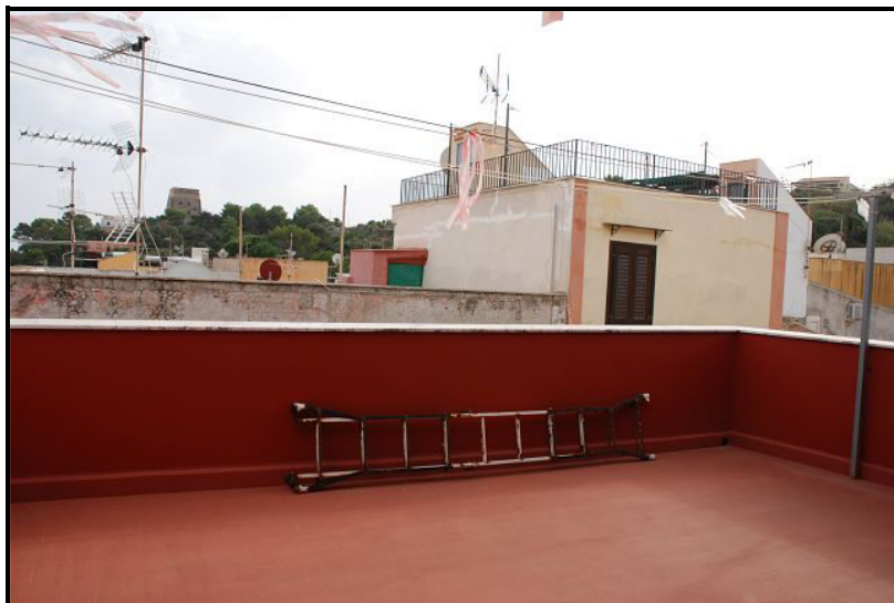
Terrazza / Terrasse