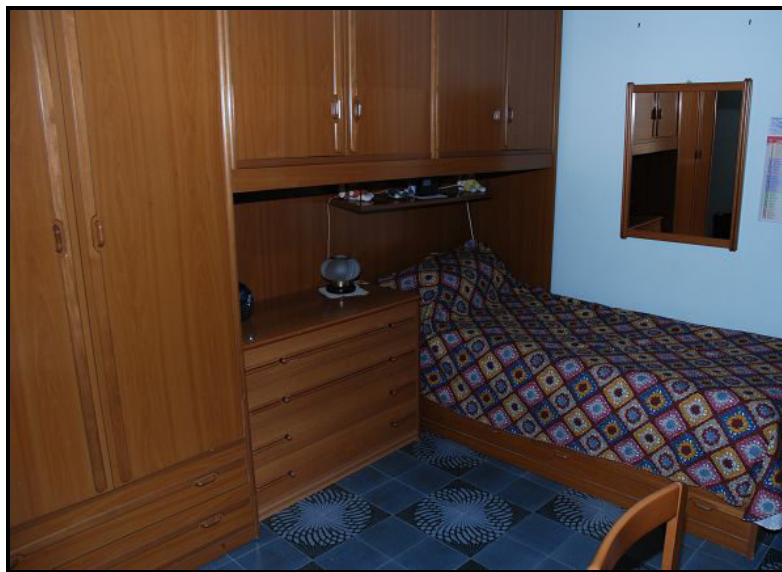
Camera / Zimmer