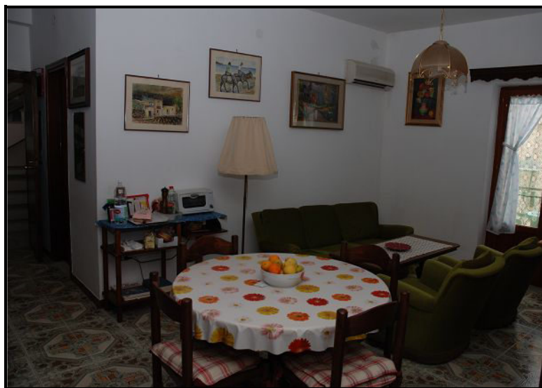
Soggiorno / Wohnbereich