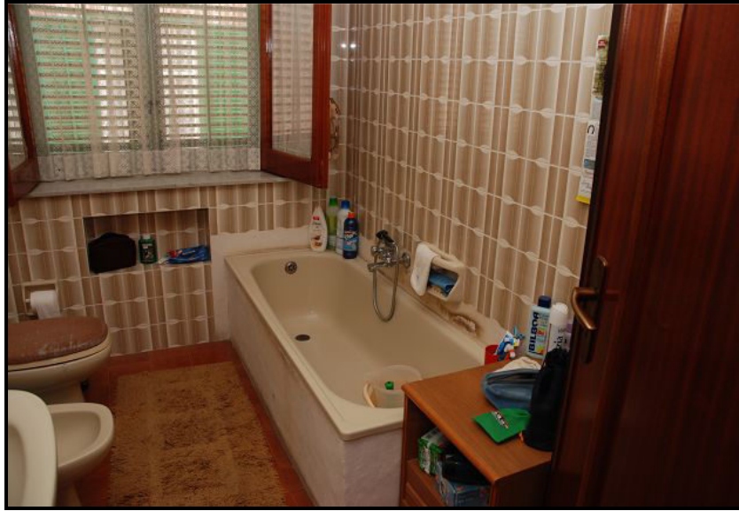
Bagno / Bad