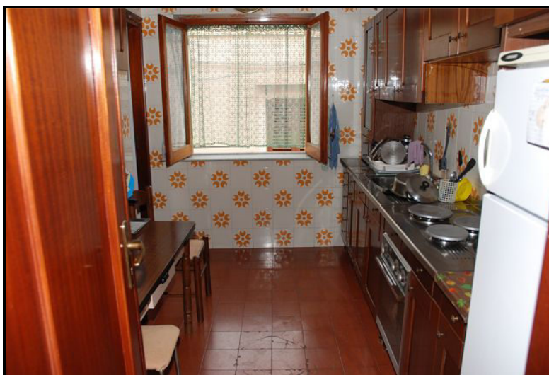
Cucina / Küche