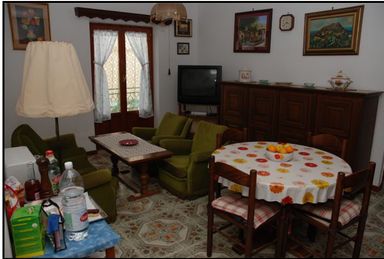
Soggiorno / Wohnbereich