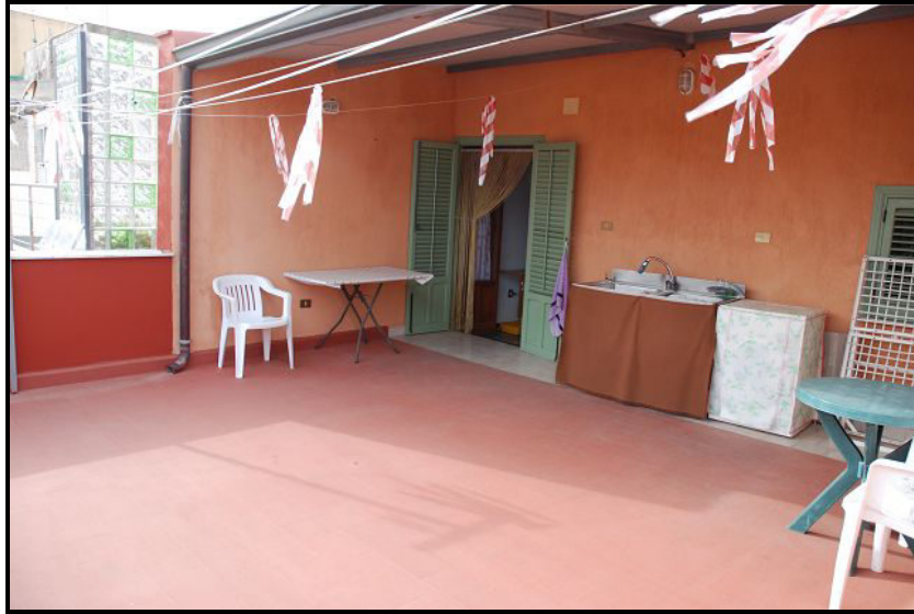
Terrazza / Terrasse