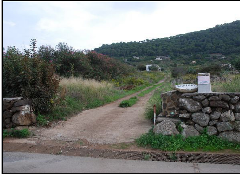
Accesso / Zufahrt