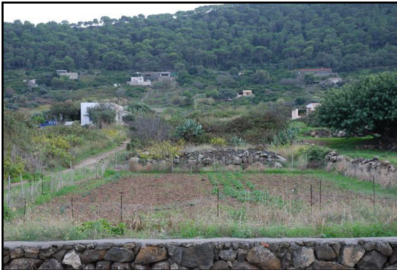
Terreno / Land