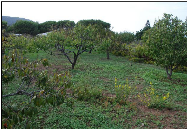
Terreno / Land