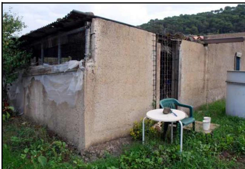
Edificio / Gebäude