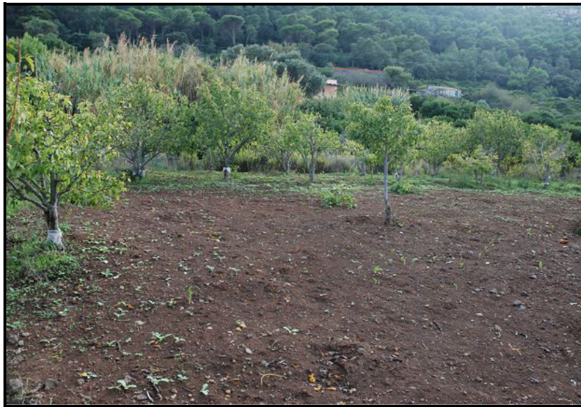
Terreno / Land