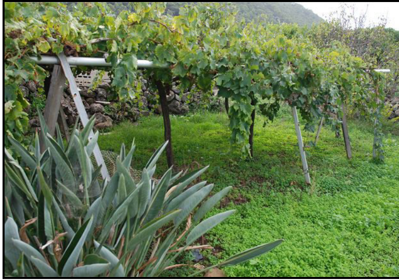
Terreno / Land