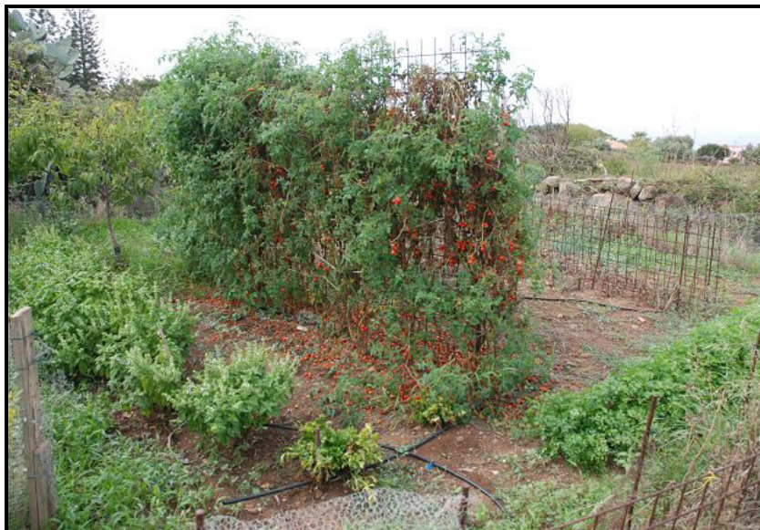
Terreno / Land