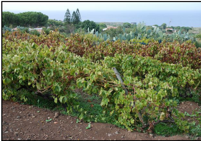
Terreno / Land