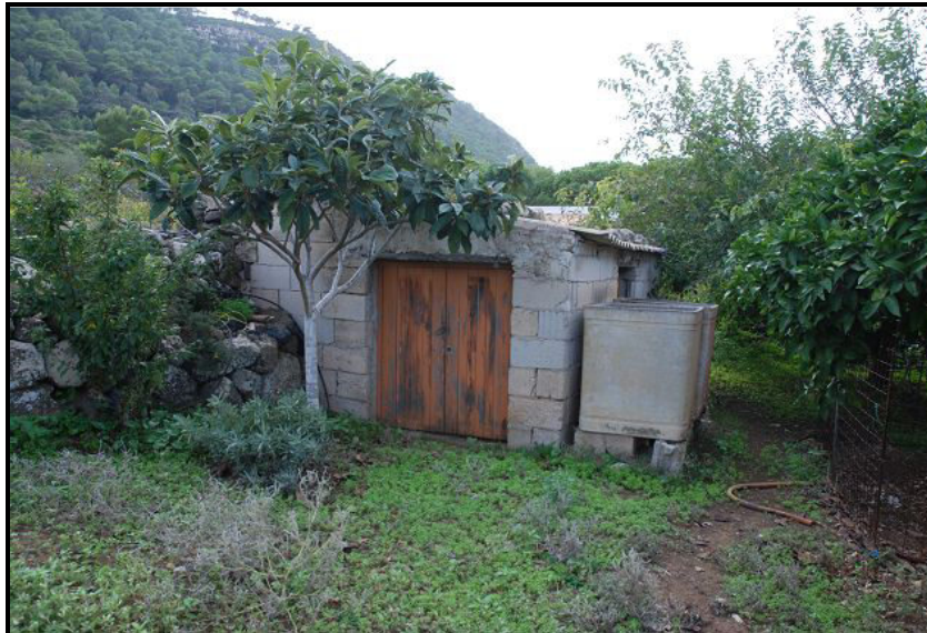
Edificio / Gebäude