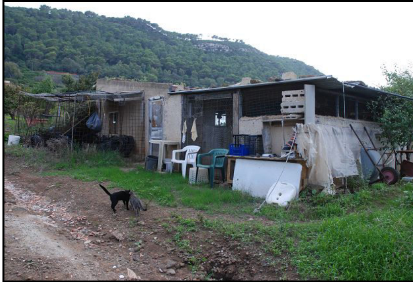
Edificio / Gebäude