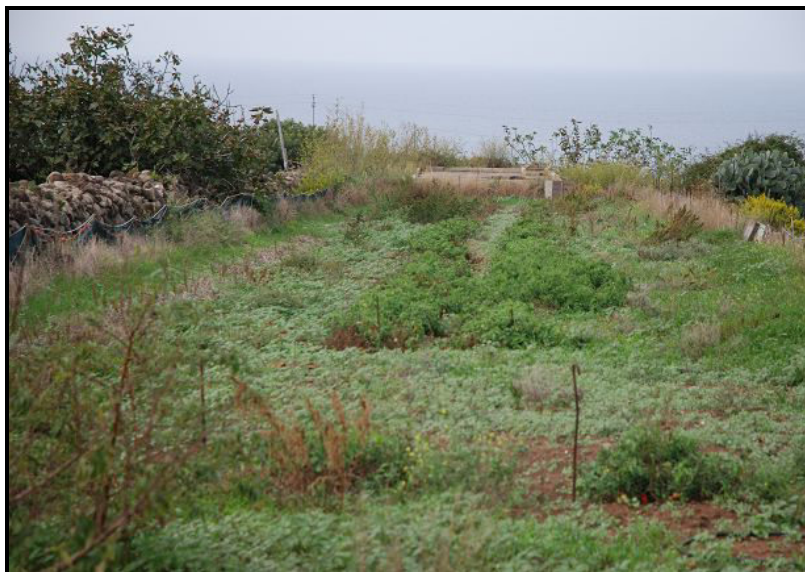
Terreno / Land