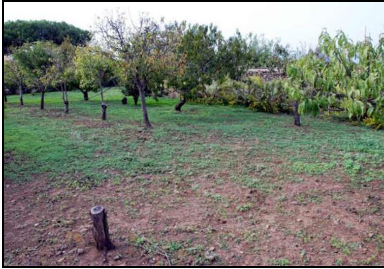
Terreno / Land