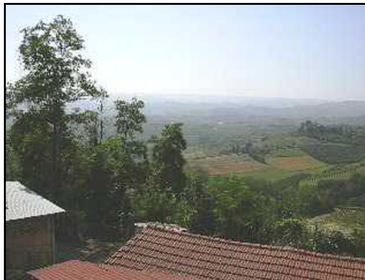
Vista / Ausblick