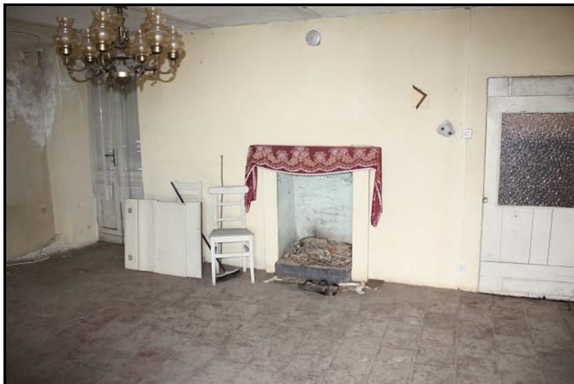
Camera nel primo piano / Zimmer im OG