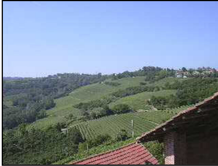
Vista / Ausblick