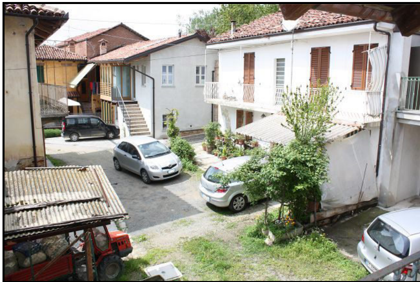
Vista ovest / Westblick