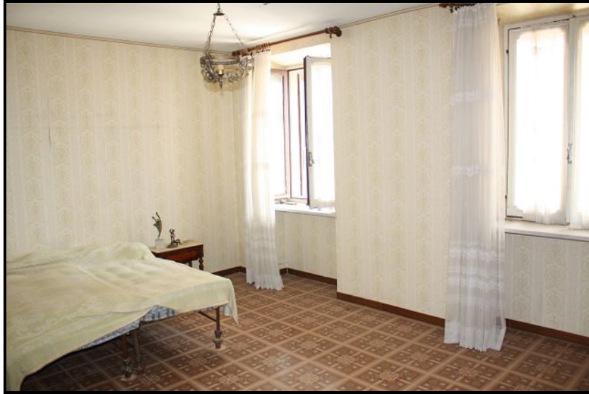
Camera nel primo piano / Schlafzimmer im OG