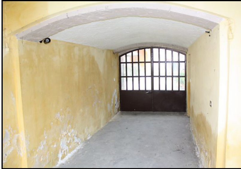
Entrata / Eingang