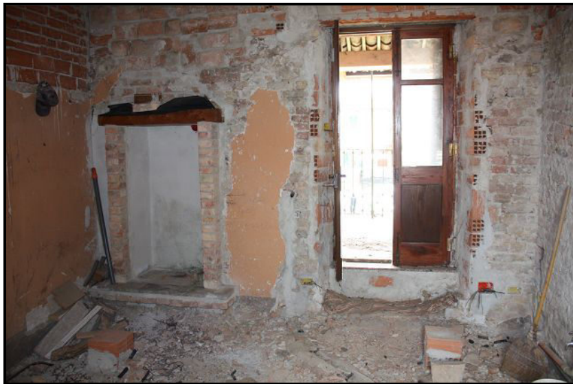
Locale nel primo piano / Raum im OG