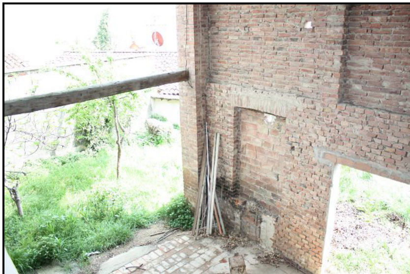
Spazio / ausbaubarer Raum