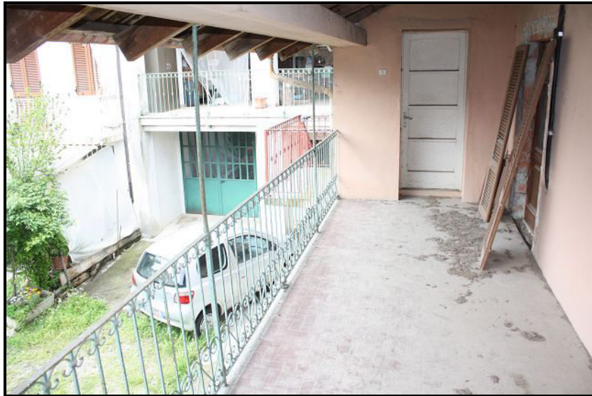
Balcone / Balkon