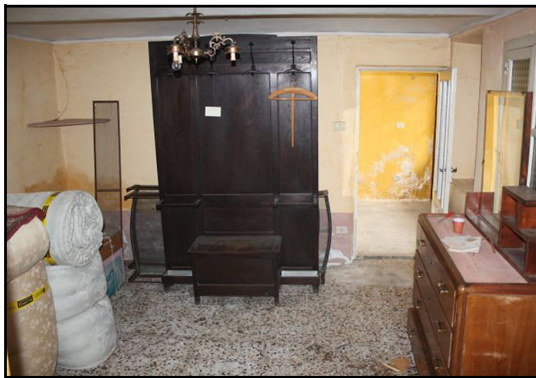
Locale PT / Raum im EG