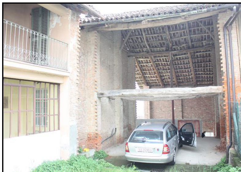
Spazio / ausbaubarer Raum