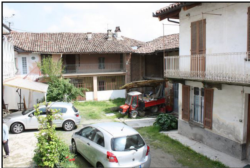
Accesso da ovest / Zufahrt von Westen