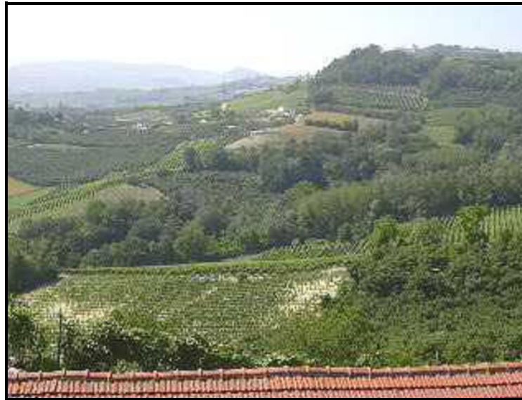
Vista / Ausblick