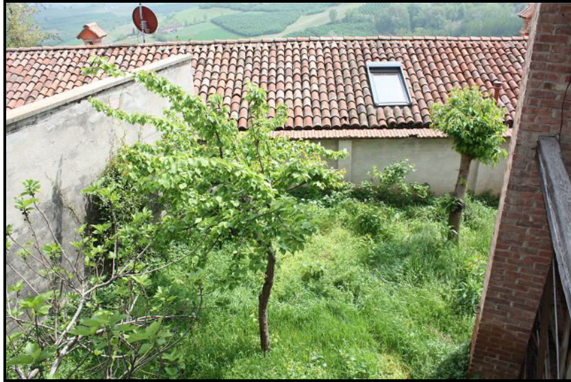
Giardino / Blick auf Garten