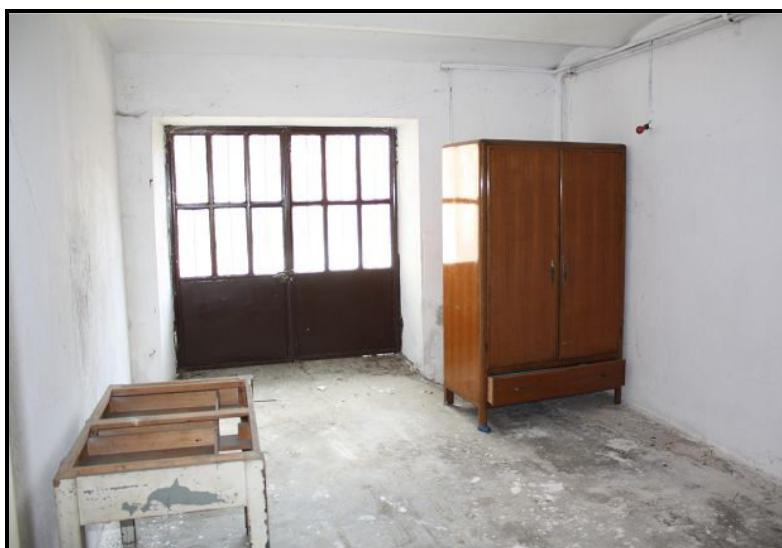
Locale PT / Raum im EG