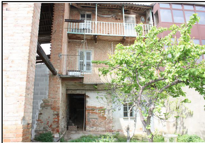
Facciata sud / Südfassade