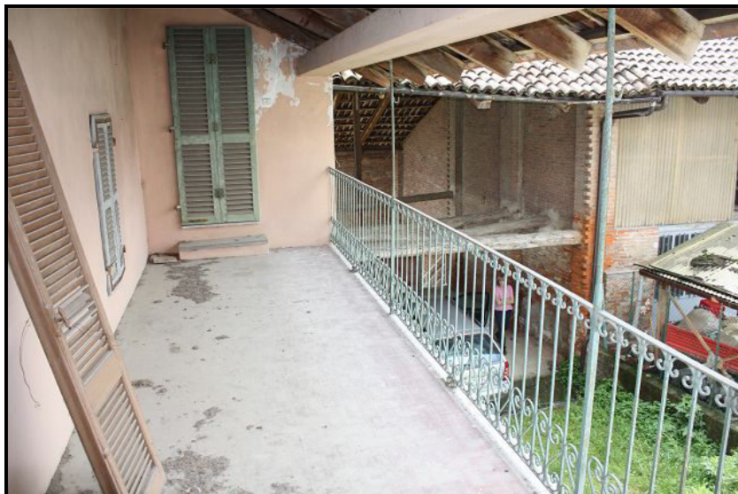
Balcone / Balkon