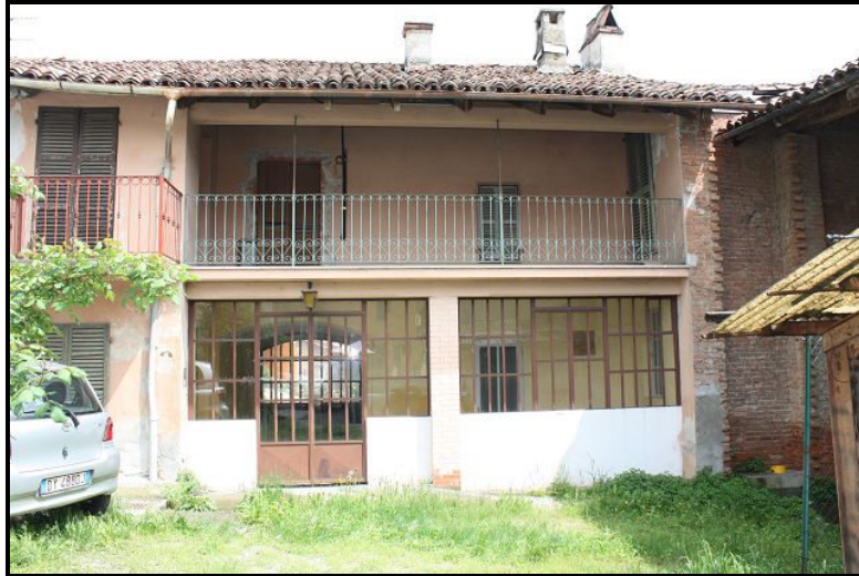
Facciata ovest / Westfassade