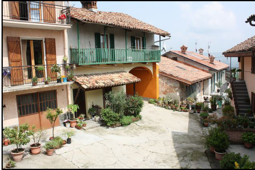
Vista vero est / Ostblick