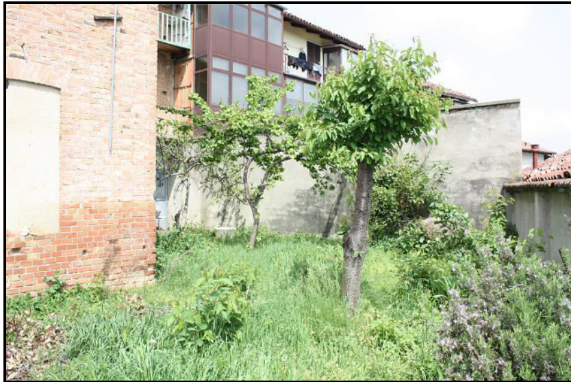
Giardino / Garten