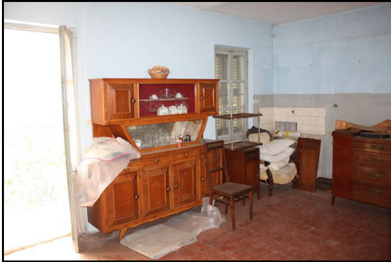
Locale PT / Raum im EG