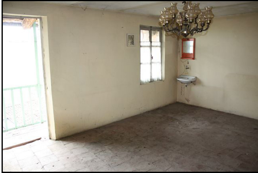
Camera nel primo piano / Zimmer im OG