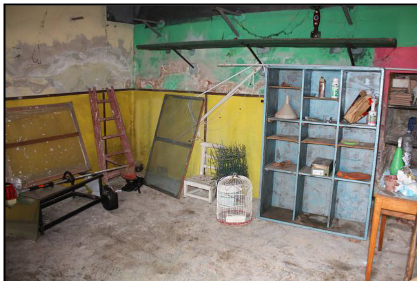
Laboratorio / Werkstatt beim Garten