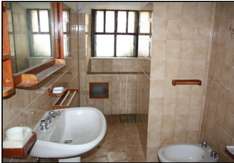
Doccia PT / Dusche im EG